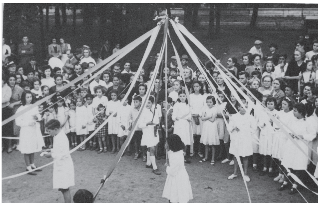
Figura 6. Fotografía de la Escuela Serena: Juegos rítmicos en una Misión Cultural en la Plaza del Barrio Alberdi. Sin fecha.