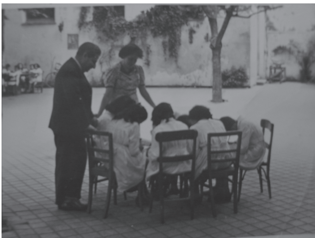
Figura 4. Fotografía de la Escuela Serena: Alumnos trabajando en el patio de la escuela, Sin fecha.