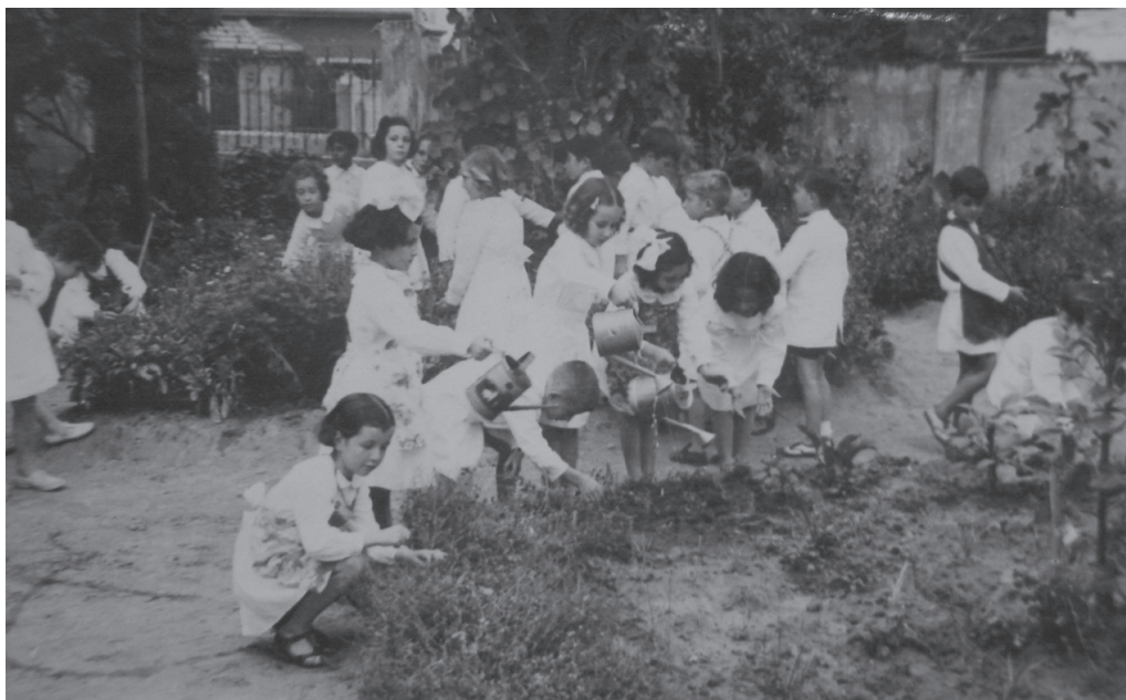
Figura 3. Fotografía de la Escuela Serena: Alumnos en la Huerta, Sin fecha.