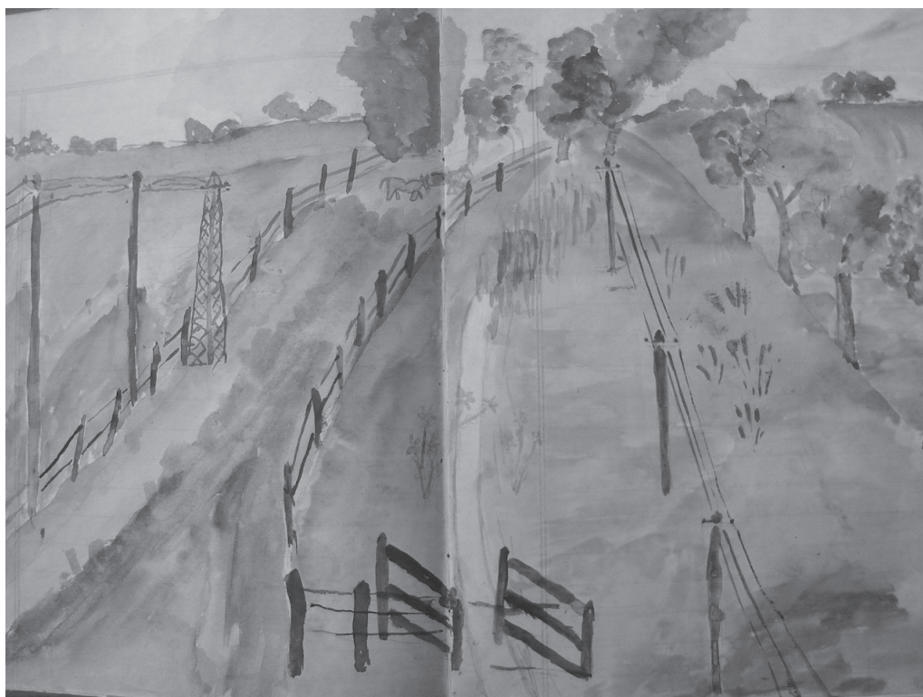
Figura 2. Cuaderno de un alumno de la Escuela Serena, 1940.