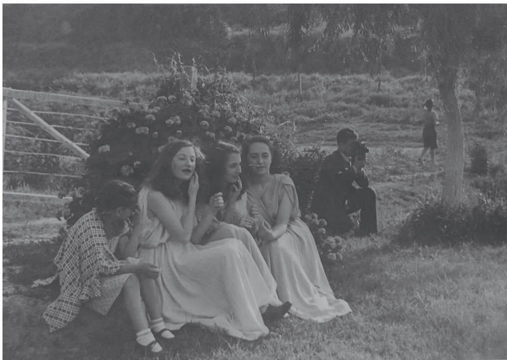
Figura 5. Fotografía de la Escuela Serena: Fiesta en el Barrio Alberdi. Fotógrafo tomando una foto. Sin fecha.