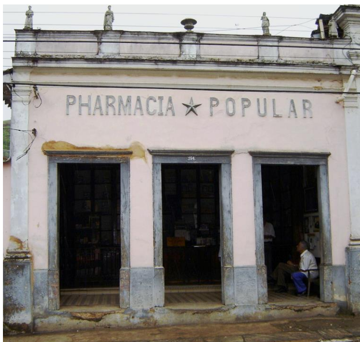
Figura 5- O ladrilho junto à entrada da Pharmacia Popular de Bananal.

Na Pharmacia Popular de Bananal – considerada a mais antiga do Brasil, localizada no interior de São Paulo e inaugurada em 1830 pelo francês Tourin Domingos Mosnier, é possível encontrar o denominado “ladrilho francês” no piso. A origem do primeiro proprietário evidencia a influência francesa na arquitetura de um modo geral e no piso em particular.