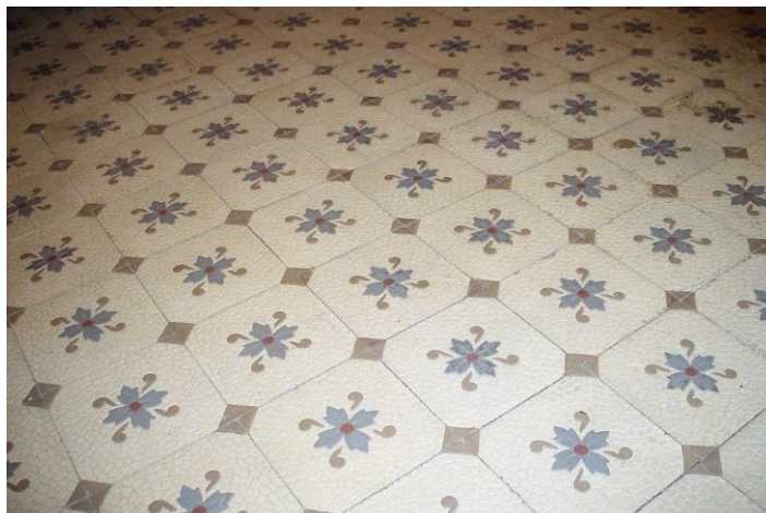
Figura 2- O ladrilho na entrada do Palacete Ramos de Azevedo em São Paulo.