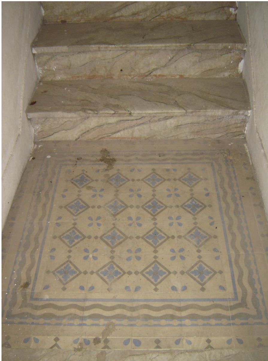
Figura 10- Ladrilho em tons azul, terracota e amarelo.

No Brás, há um cortiço na sobreloja de um bar, situado na Av. Celso Garcia, que mantém seu ladrilho hidráulico no hall da escada em tons azul, terracota e amarelo.