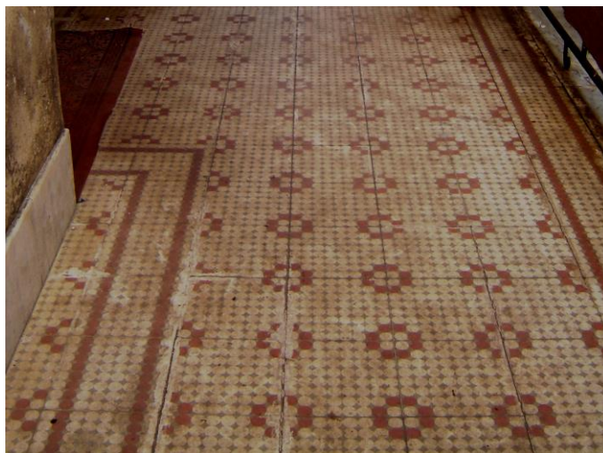
Figura 7- Ladrilho com motivos geométricos com predomínio do bege e terracota.

No bairro da Liberdade, nas antigas casas assobradadas de classe média, com seus gradis de ferro, portas e janelas de pinho de riga, e porão alto para proteger o piso assoalhado, o ladrilho pode ser visto no hall de entrada e na cozinha, com motivos quase sempre geométricos, e a “terracota” e o bege como cores predominantes. Nessas construções, o ladrilho permanece praticamente intacto a meia poeira.