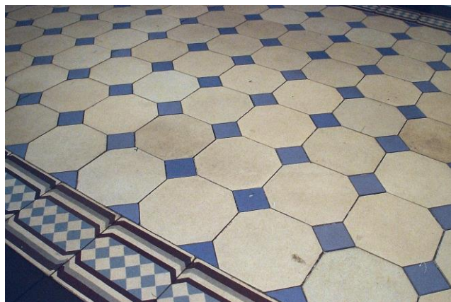
Figura 1- O ladrilho na varanda do Palacete Ramos de Azevedo em São Paulo.

O ladrilho foi empregado junto à entrada do palacete, no vestíbulo e na varanda que circundava a construção no pavimento térreo, estando sempre à vista dos visitantes e compondo a arquitetura feita segundo os gostos e padrões europeus, como os demais elementos construtivos.