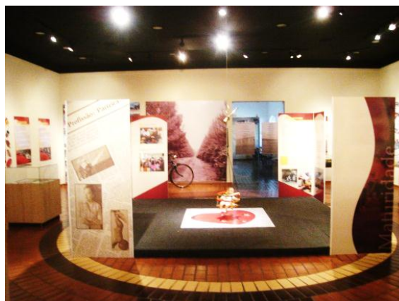
Figura 4: terceiro módulo com destaque para o tablado central