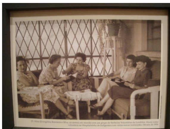
Figura 5 - "Senhoras Voluntárias de Londrina"