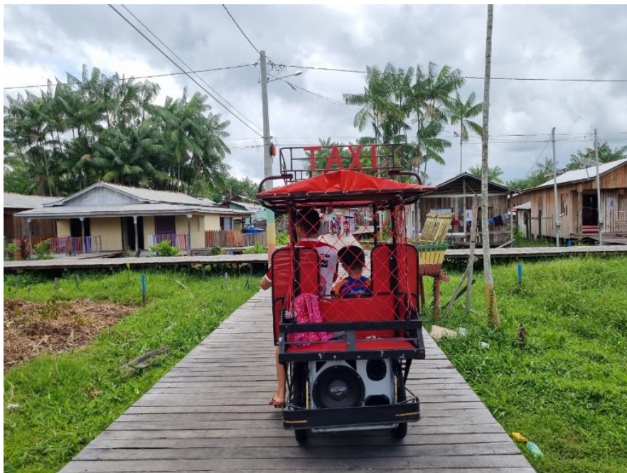
Figura 4 – Bicitáxi em Afuá