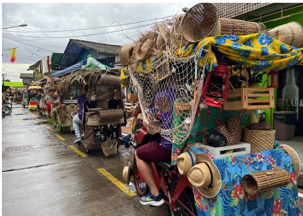
Figura 5 – Biciata no Festival do Camarão de 2024