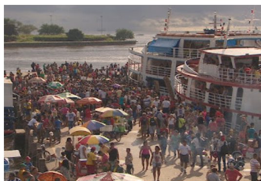
Figura 3 - Barcos rumo ao festival.