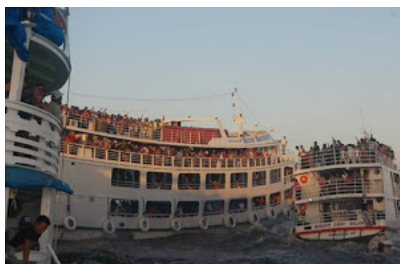
Figura 2 - Rampa do santa Inês, em Macapá.

Durante o festival, a cidade é ressignificada. A área pública designada para a festividade, conhecida como “camaródromo”, torna-se o centro das atividades, recebendo apresentações culturais, disputas simbólicas e a presença de visitantes de várias partes do Brasil e do exterior (figuras 2 e 3). Nesse período, Afuá experimenta um uso intensivo de seu território, evidenciado pela circulação de embarcações, aeronaves de pequeno porte e pela adaptação das residências, que muitas vezes são alugadas para turistas. Essa mobilização reforça a capacidade da população local de transformar seu uso do território de acordo com as demandas do evento, sem abrir mão de sua identidade.