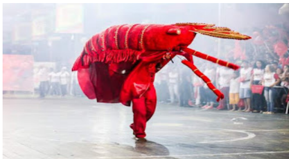
Figura 5 – Camarão Pavulagem.