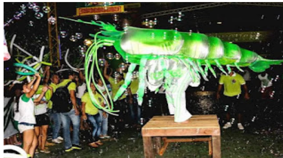
Figura 6 – Camarão Convencido