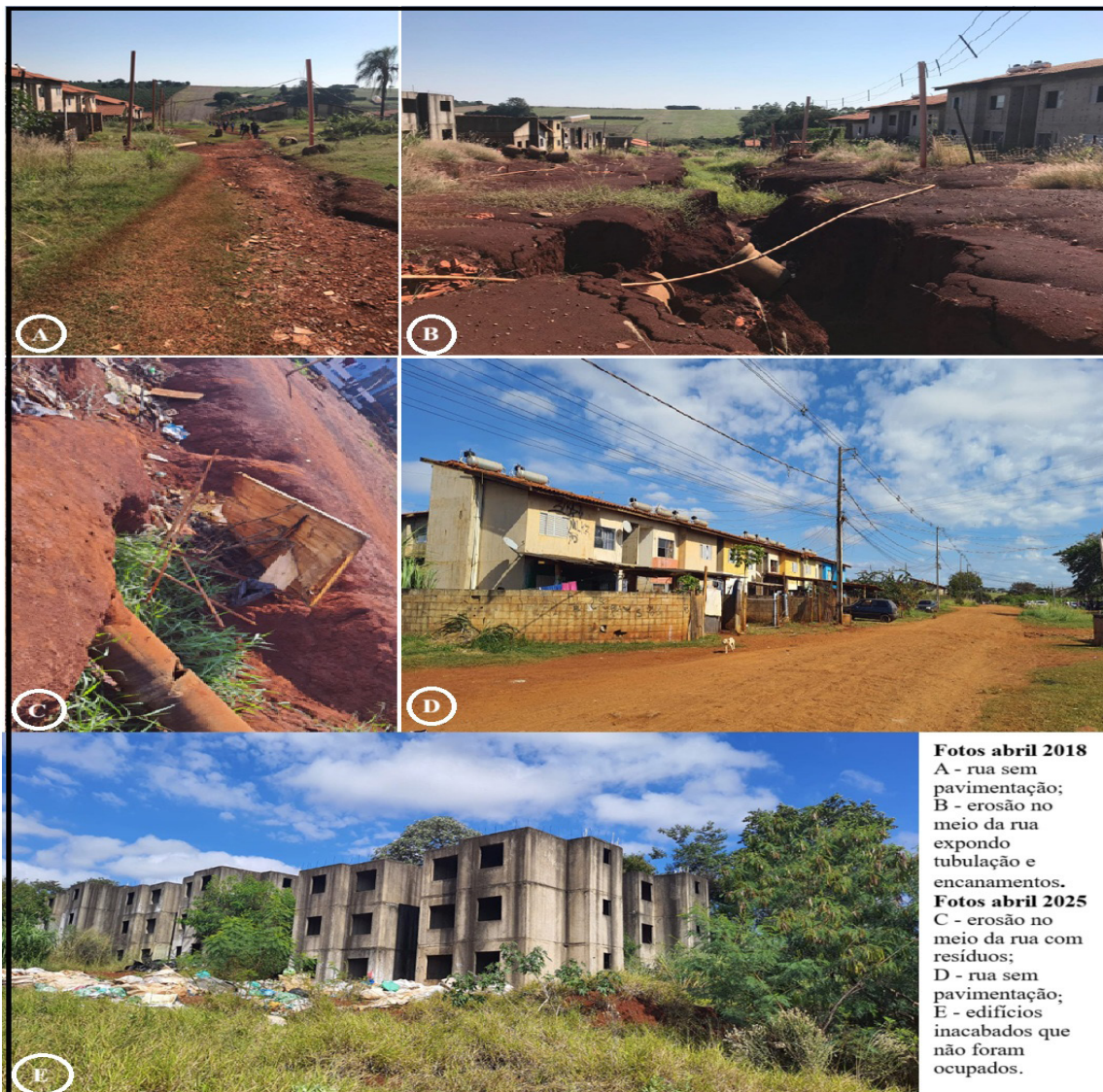
Figura 2 - Vista parcial do empreendimento Flores do Campo em Londrina em 2018 e 2025