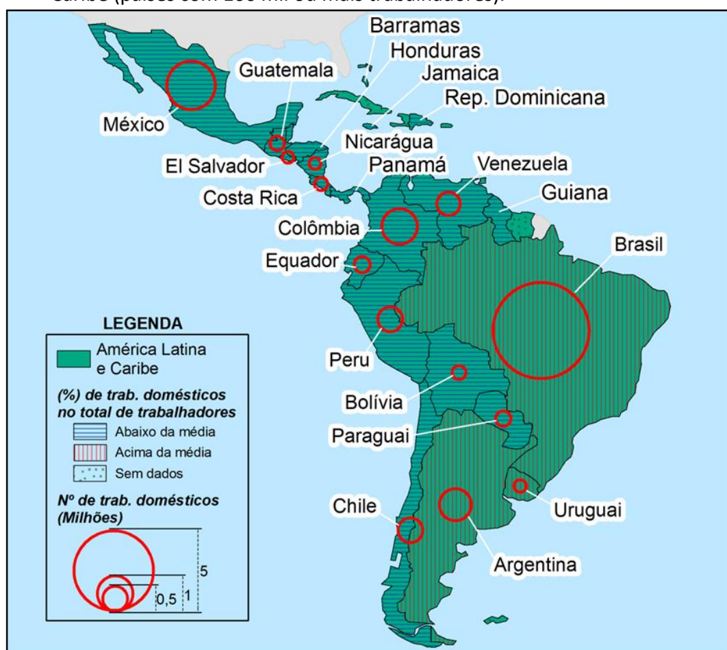
Figura 4 - Distribuição da população de trabalhadores domésticos na América Latina e Caribe (países com 100 mil ou mais trabalhadores).