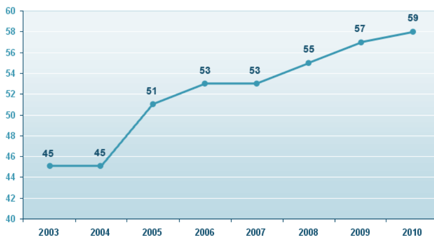
Gráfico 2 – Crescimento das universidades federais que aderiram ao Reuni (2012).