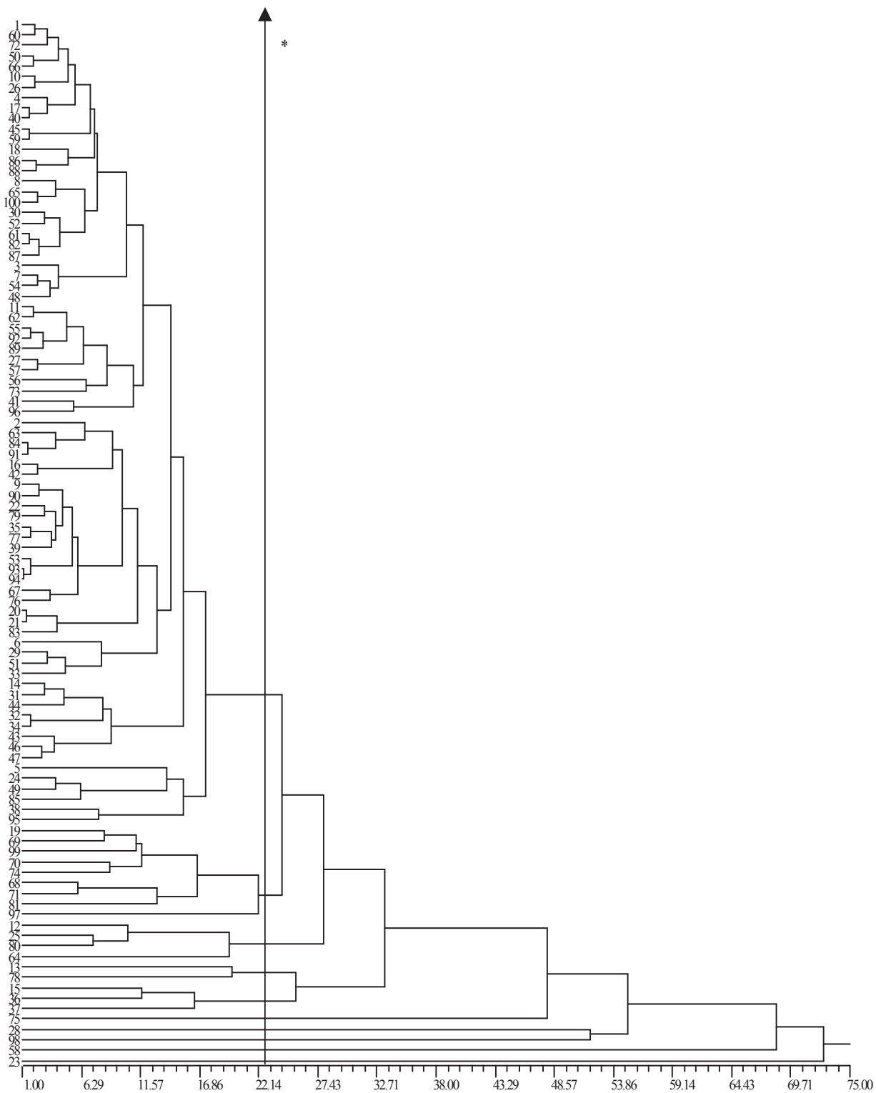
Figura 2. Dendrograma de distância fenotípica pelo método de agrupamento UPGMA decorrentes da avaliação de uma população com 100 famílias de cenoura cultivadas no sistema de produção agroecológico Agricultura Orgânica (AO). *Distância média entre as famílias (22,25), Brasília, 2008.