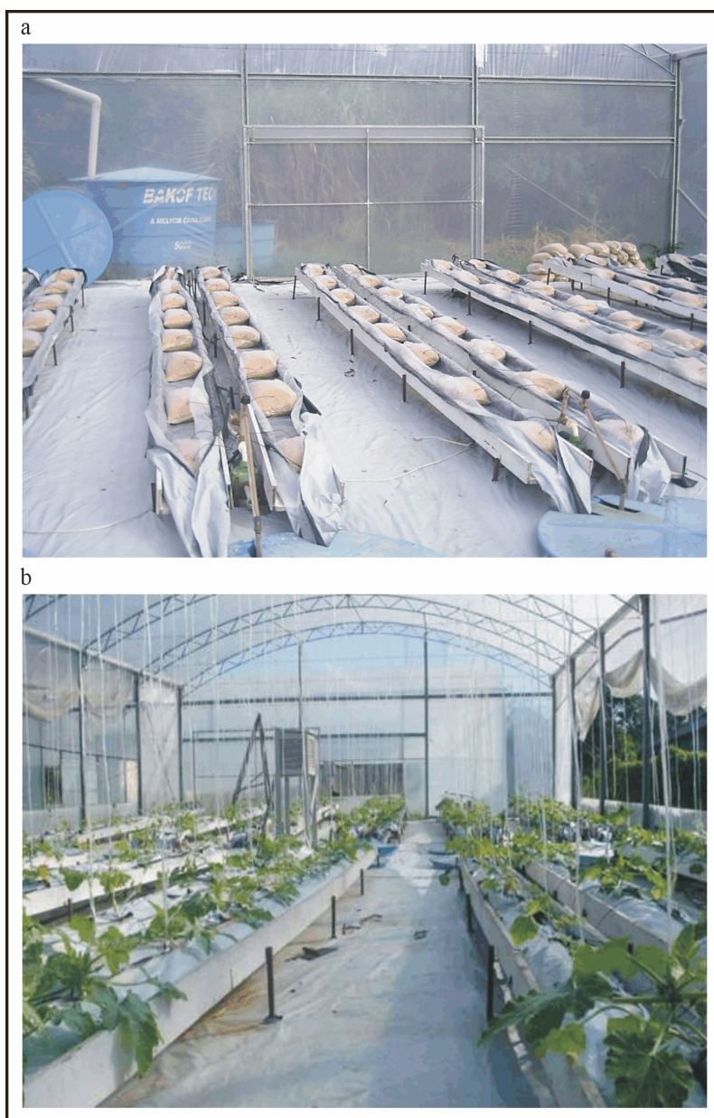
Figura 1. Sistema de cultivo sem solo com recirculação da solução nutritiva e substrato de casca de arroz in natura utilizado na pesquisa. a) Sistema pronto para o transplante das mudas; b) Sistema em pleno funcionamento. Pelotas, UFPEL, 2006.

Após o transplante das mudas, selecionou-se duas plantas por repetição, sobre as quais manteve-se total controle da colheita e remoção de folhas. O crescimento da cultura foi determinado pela quantificação da produção e da partição de massa seca aérea das plantas controle aos 68 e 55 dias após o transplante, no experimento de primavera-verão e de verão-outono, respectivamente, incluindo os