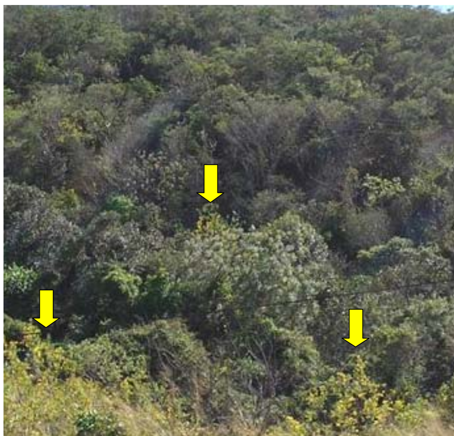
Figura 5. Focos do amarelinho na borda e inserido no remanescente florestal

Local: Microbacia Hidrográfica Água das Perobas