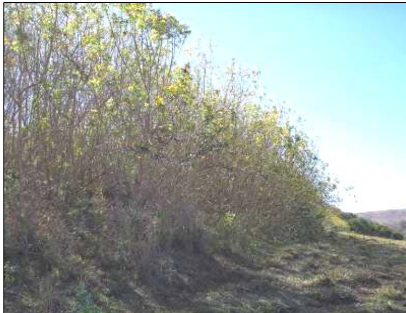
Figura 3. Esgotamento da gramínea da pastagem devido à sombra do Tecoma stans

Local: Microbacia Hidrográfica Água do Cateto