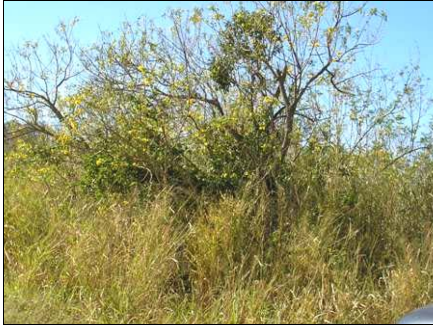
Figura 2. Infestação em áreas de abandono

Local: Microbacia Hidrográfica Água do Cateto