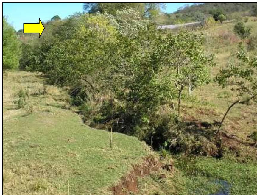
Figura 4. Infestação em matas ciliares

Local: Microbacia Hidrográfica Água das Perobas