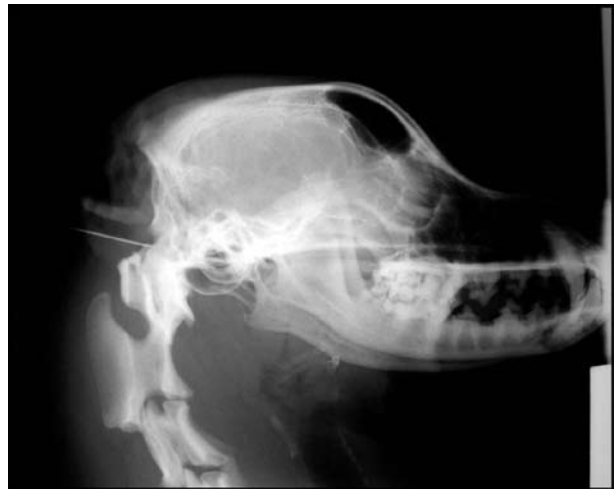
Figura 2. Imagem radiográfica de cão anestesiado com a agulha inserida no espaço atlanto-occipital para colheita de LCR.

A inserção da agulha era sempre perpendicular à pele, e realizada de maneira delicada e progressiva, até que se atingisse o espaço subaracnóide, de onde fluía o LCR. Radiografias foram realizadas para registrar o correto posicionamento da agulha (Figura 2).