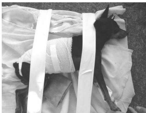
Figura 2. Imobilização de paciente com trauma medular toracolombar

Mesmo com o animal imobilizado é importante executar um cuidadoso exame neurológico para localizar o segmento medular afetado e determinar o grau de severidade da lesão (LANZ; BERGMAN; SHELL, 2000). Na escolha do tratamento adequado deve-se considerar o tipo e a gravidade da lesão da medula espinhal, sendo que esta é detectada pelo exame neurológico (STURGES ; LECOUTER, 2002). Muitas vezes a alteração é tão discreta que a função normal pode retornar sem qualquer tratamento (JEFFERY; BLAKEMORE, 1999). Outro fator a ser considerado é o tempo de ocorrência do trauma, visto a terapia neuroprotetora só ser eficaz quando administrada dentro de um tempo restrito (JEFFERY; BLAKEMORE, 1999).