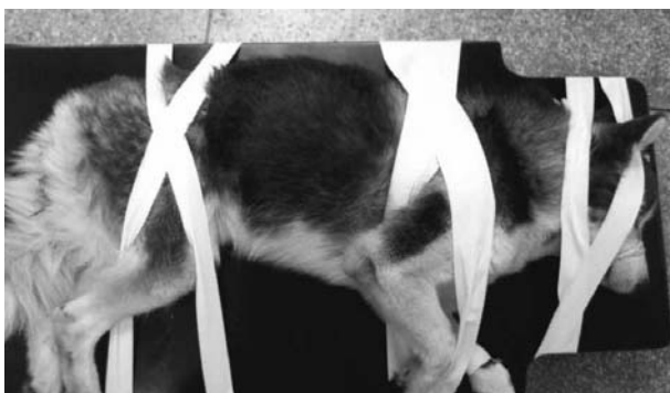
Figura 1. Imobilização de paciente com suspeita de trauma medular cervical.