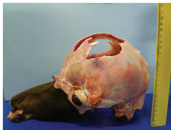
Figura 1. Cabeça de potro com hidranencefalia, presença de ossos delgados e flexíveis com formação incompleta.

Ribeiro, Galina e Sato (1982) descreveram a hidranencefalia em crianças, caracterizada por transluminação anormal do crânio devido seu conteúdo ser predominantemente líquido. Nessas circunstâncias o córtex está em sua totalidade ou em sua maior parte, reduzido a uma membrana translúcida.