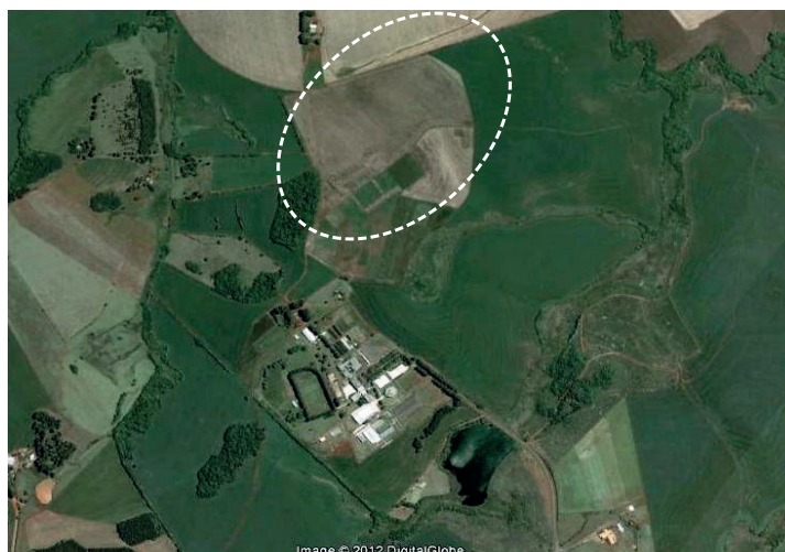
Figura 1. Imagem aérea mostrando a localização do Campus da Unicruz, em Cruz Alta, Rio Grande do Sul, 2010 e 2011. Em destaque a área onde foram realizados os plantios.

As coletas foram realizadas no Município de Cruz Alta, RS, na área experimental do Campus da Universidade de Cruz Alta (UNICRUZ), que pertence à Mesorregião Noroeste e localiza-se a uma latitude de 28° 38' 19" sul e longitude de 53° 36' 23" oeste, com altitude média de 452 metros (Figura 1).