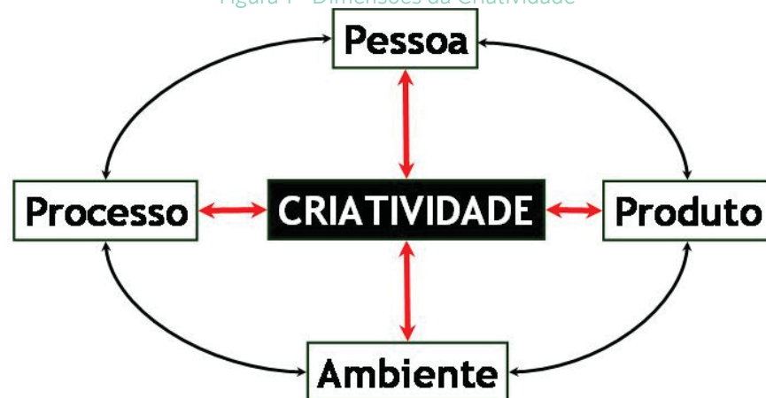
Figura 1 - Dimensões da Criatividade

Gil da Costa (2000) apresenta quatro grandes dimensões da criatividade, figura 1.