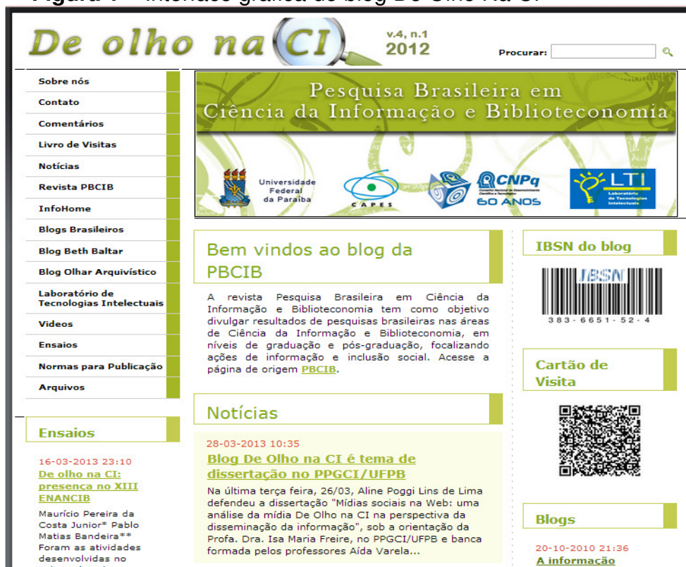
Figura 1 – Interface gráfica do blog De Olho Na CI