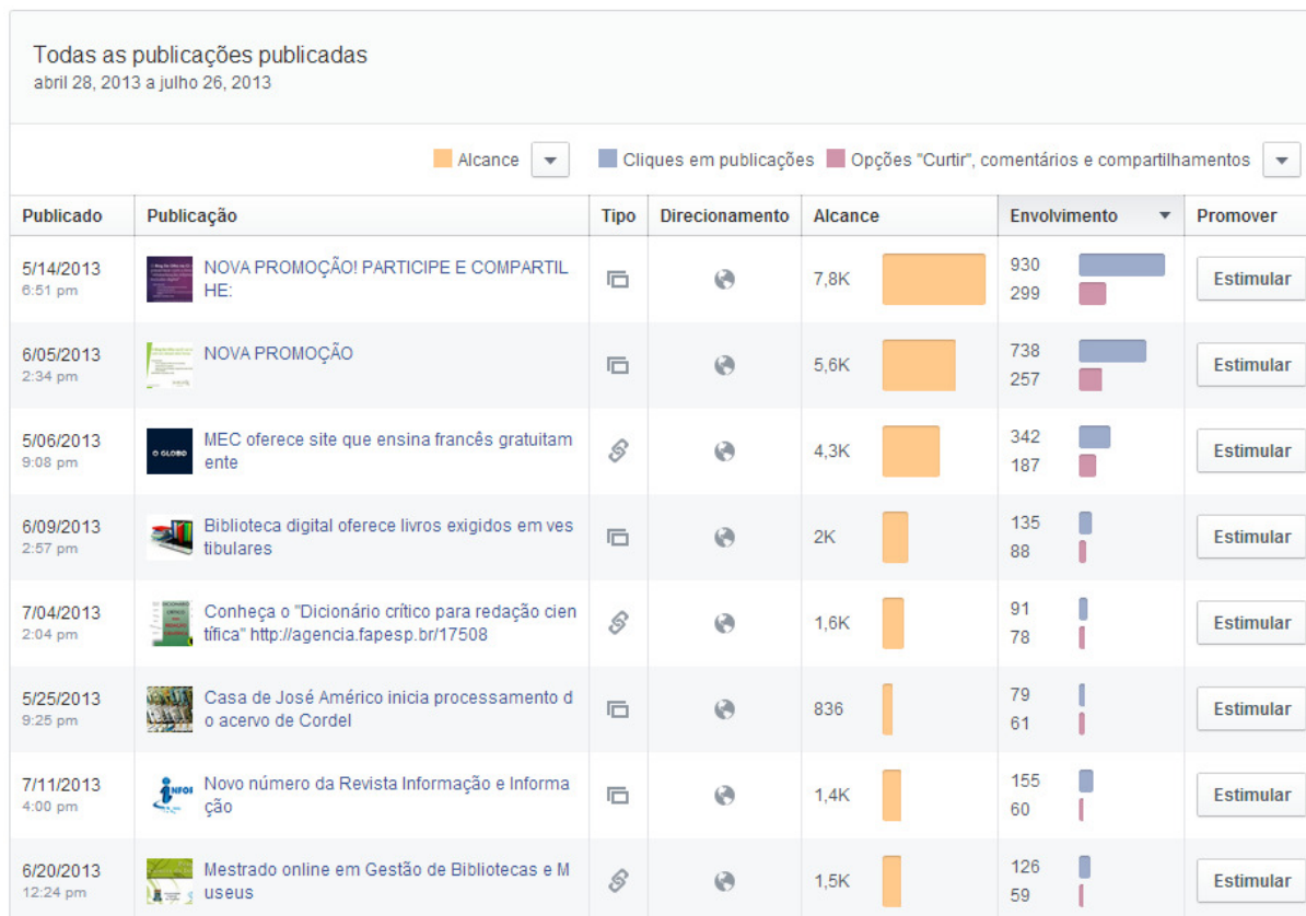
Figura 4 – Números alcançados no Facebook no período de 28/04/2013 a 26/07/2013