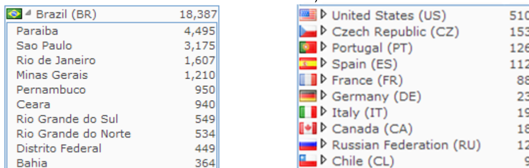
Figura 3 – Total e distribuição geográfica de visitantes únicos (Dados de 13/06/2011 a 19/11/2013)