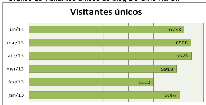
Gráfico 1 – Gráfico de visitantes únicos do blog De Olho Na CI.