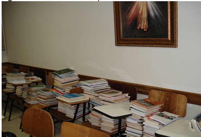
Figura 2: Material selecionado para iniciar o acervo.

As tarefas foram divididas entre os membros da equipe, ficando os bibliotecários responsáveis pelo trabalho especializado de classificação, indexação e catalogação e os demais pelo trabalho de carimbagem e etiquetagem.