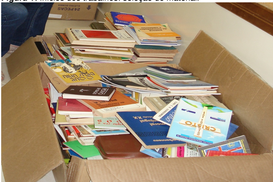
Figura 1: Inícios dos trabalhos: seleção do material.

Os livros, antes de serem catalogados, passaram por um processo de limpeza, higienização e verificação das condições de uso.