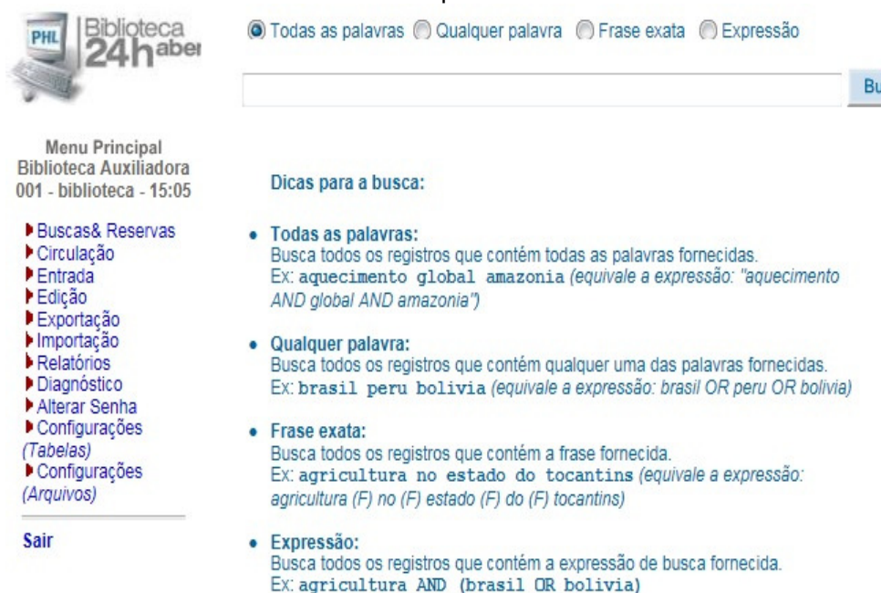
Figura 4: Interface inicial do software PHL depois de instalado.