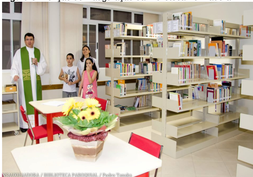
Figura 5: Benção de inauguração da Biblioteca Auxiliadora.