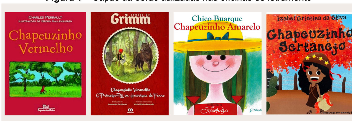
Figura 1 – Capas da obras utilizadas nas oficinas de letramento