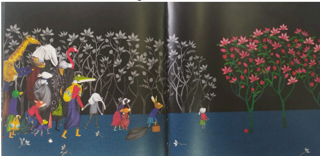
Figura 5 - Cena final