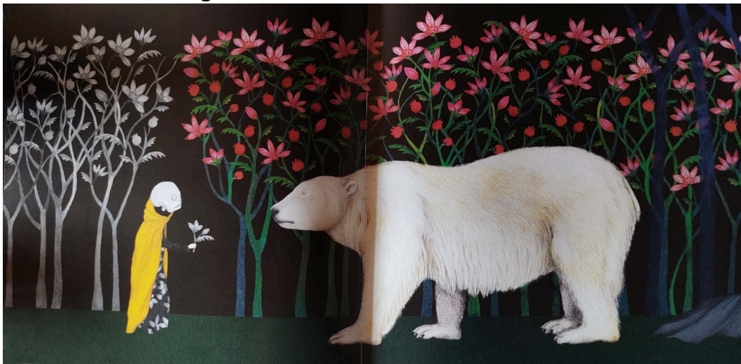
Figura 2 - Cena do urso encarando a morte.

de espécie, linguagem e cultura. Em outras palavras, o urso sem traços humanos torna o momento mais direto, cru e universal, intensificando o peso emocional da cena. O contraste abre um espaço interpretativo, um silêncio que “fala” (Bajour, 2023), que convida o leitor a imaginar o não dito e a perceber a tensão entre esperança e perda, continuidade e finitude. Por isso, o silêncio não aparece apenas como ausência, mas como espaço fértil de elaboração subjetiva, dependente das experiências do leitor e das memórias que ele mobiliza para atribuir sentido ao que não é mostrado (Bajour, 2023, p. 84).