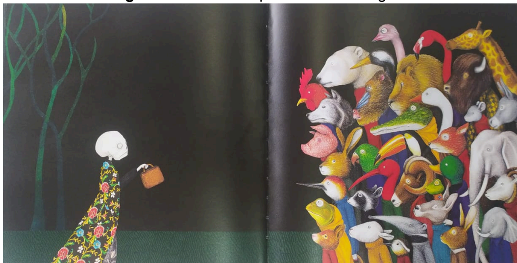
Figura 6 - Cena em que a morte carrega a mala.

No lado direito da página dupla (figura 6 – p. 5), os personagens animais antropomorfizados se amontoam em cores vivas, atentos ao objeto que lhes é apresentado. Seus olhares, gestos e roupas expressam comportamentos e emoções tipicamente humanos, como surpresa, tensão ou reconhecimento. Nesse ponto, a ausência de qualquer explicação verbal sobre quem é o dono da mala ou o que ela guarda transforma o silêncio em linguagem visual, abrindo espaço para que cada leitor preencha esse vazio com sua própria interpretação. Como aponta Bajour (2023), trata-se de um silêncio expressivo, um espaço ativo e vivo de elaboração subjetiva, no qual o leitor é convidado a imaginar, sentir e atribuir significado para além do que está visível na página.