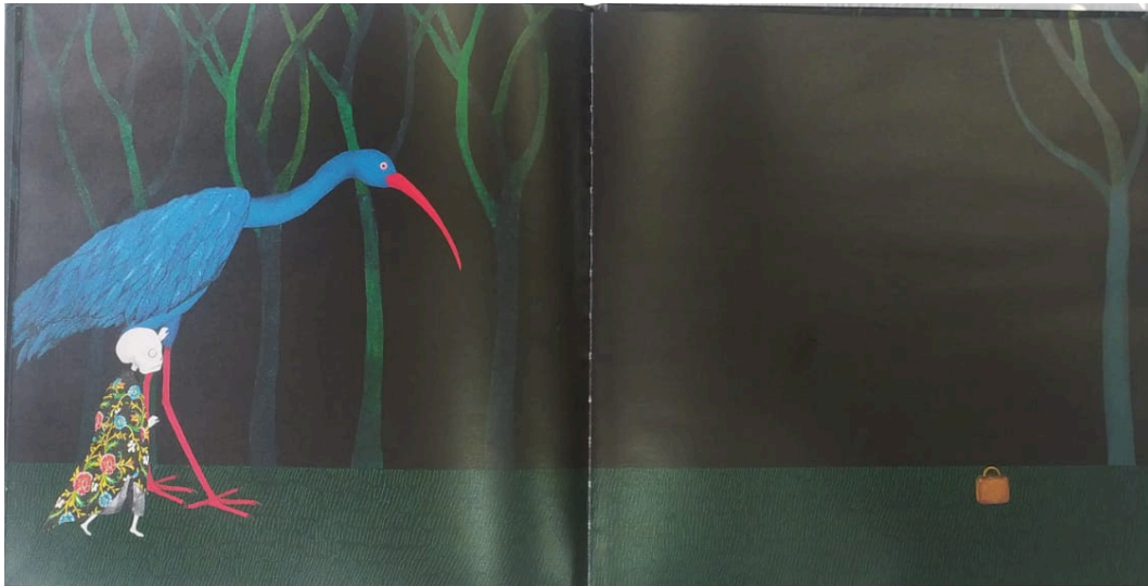
Figura 4 - Cena em que a mala aparece pela primeira vez.