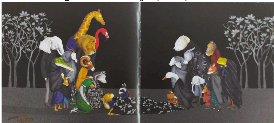
Figura 3 - Cena da vegetação em preto e branco.