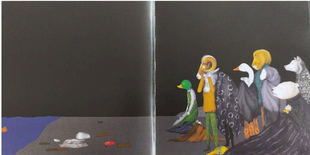
Figura 7 - Cena dos animais após o naufrágio