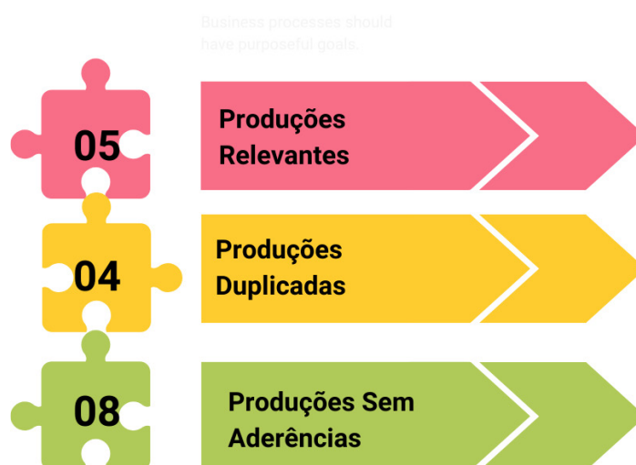
Figura 2 - Classificação das Produções Identificadas no Portal de Periódicos

A Figura 2 apresenta a classificação das produções do Portal de Periódicos, evidenciando a proporção entre estudos relevantes, duplicados e não aderentes à temática.