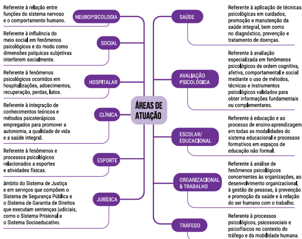
Figura 2 - Áreas de actuación de la psicología

Fuente: Consejo Federal de Psicología (p. 17, 2022).