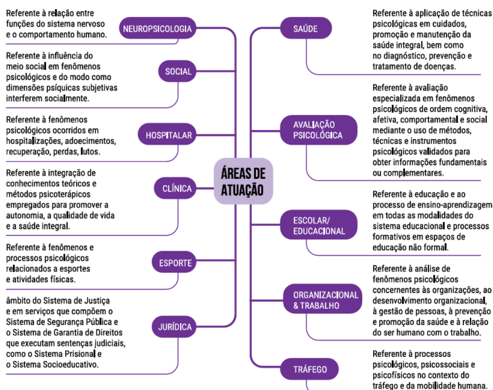
Figura 2 - Áreas de actuación de la psicología