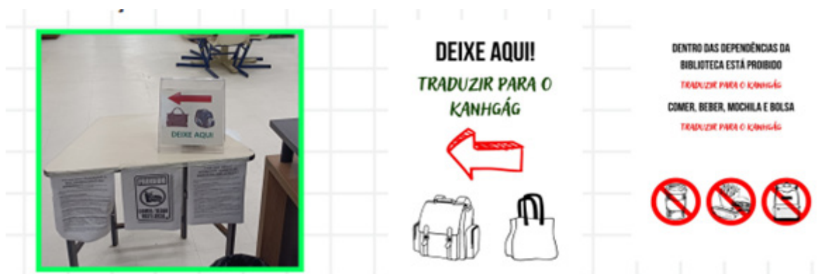
Figura 1 - Prototipo de carteles informativos antes de entrar a la biblioteca escritos en Kanhgág