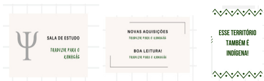
Figura 3 - Prototipo de la placa de señalización y ambientación traducida al Kanhgág