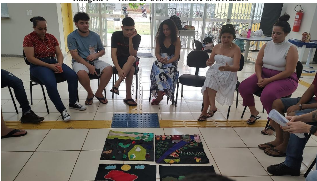
Imagem 9 – Roda de Conversa sobre os Bordados

Nota: Relato de experiências.