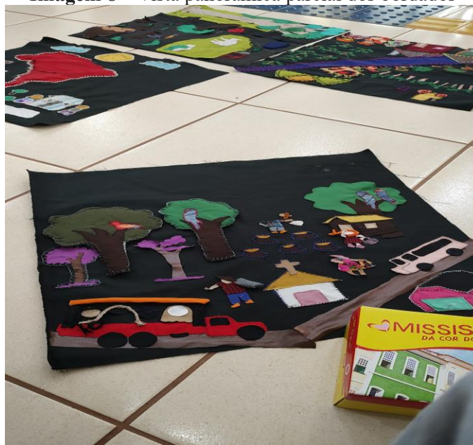
Imagem 8 – Vista panorâmica parcial dos bordados

Nota: Resultado parcial dos bordados.