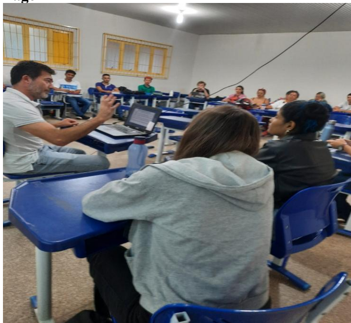
Imagem 1 – Palestra sobre a Ditadura Militar no Chile

Nota: Estudantes na Palestra.