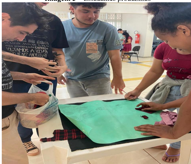
Imagem 3 – Estudantes produzindo

Nota: Escolha e representação no papel da arte a ser transferida para a produção arpillera .