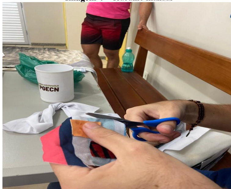
Imagem 4 – Trabalho manual

Nota: Corte de retalhos.