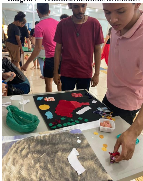
Imagem 7 – Estudantes montando os bordados

Nota: Trabalho coletivo.