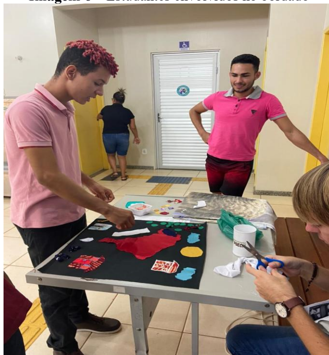
Imagem 6 – Estudantes envolvidos no bordado

Nota: Trabalho em Equipe.