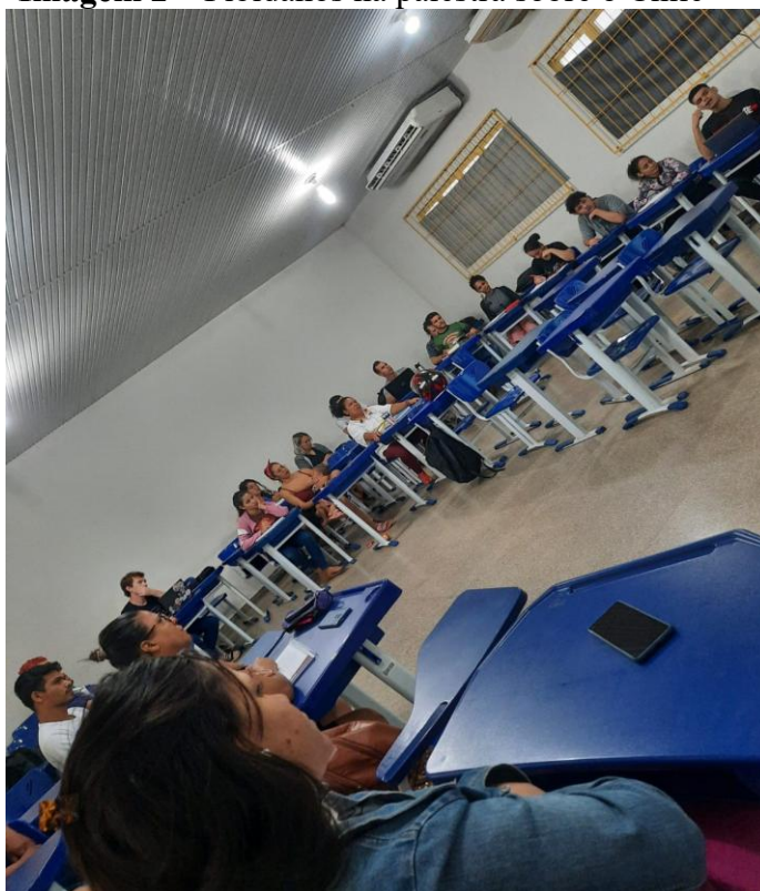
Imagem 2 – Pibidianos na palestra sobre o Chile

Fonte: A própria autora (2023). Nota: Estudantes assistindo e participando da palestra.