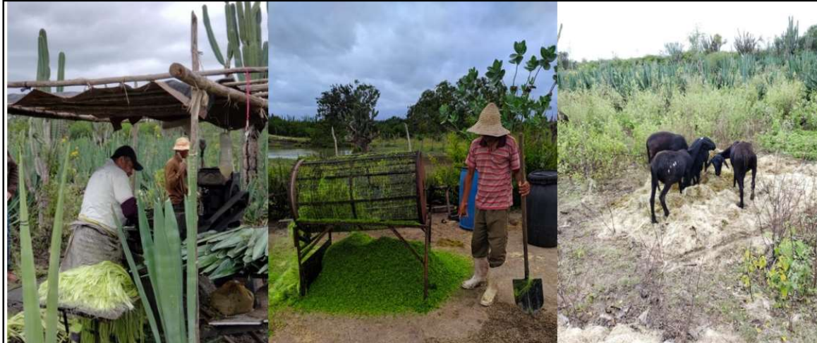
Figura 2 – Reaproveitamento de resíduos para alimentação animal