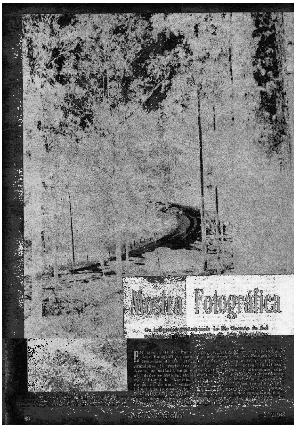
Figura 1: Mostra Fotográfica. Revista do Globo. Porto Alegre, ano XX, n. 453, p.48, 21/02/1948. Tam. original: 20,5 x 28,5cm.