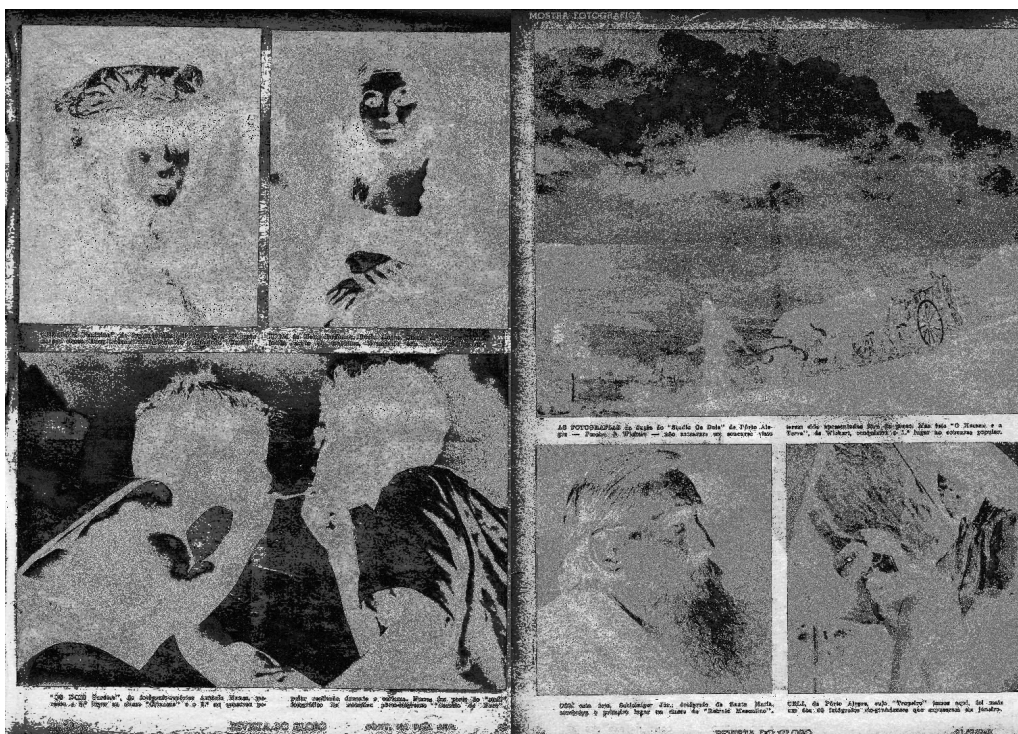
Figura 2: Mostra Fotográfica. Revista do Globo . Porto Alegre, ano XX, n. 453, p.49-50, 21/02/1948. Tam. original: 20,5 x 28,5cm.

As imagens das categorias retrato masculino, retrato feminino e vistas do Rio Grande do Sul obedecem a cânones tradicionais da fotografia pictorialista, que tinha como objetivo central fazer da fotografia uma obra de arte. Para tal intento fotografava motivos que se associavam a formas bastante tradicionais da pintura, como pode ser percebido no retrato feminino da direita. Os retratos remetem ao espaço tradicional de produção, os estúdios fotográficos. Sujeitos retratados no enquadramento clássico com o rosto em \frac{3}{4} emprestam altivez e dignidade, reforçado pelos adereços. Já na fotografia de maiores dimensões da esquerda, da categoria vistas do Rio Grande do Sul, sugere uma paisagem bucólica, com grande parte do espaço fotográfico destinado ao horizonte.