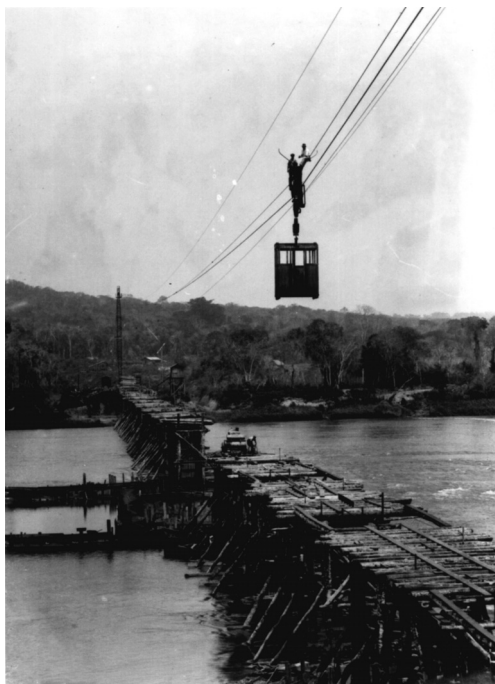
Construção da ponte ferroviária sobre o rio Tibagi

Juliani gostava muito de caçar e pescar. Mas praticamente abriu mão desses prazeres pessoais para se dedicar à fotografia. Durante a semana, invariavelmente estava a serviço da Companhia de Terras, além de fotografar uma ou outra pessoa que o procurava. Nos finais de semana, Londrina era “invadida” por pessoas que vinham da roça ou de outras localidades para fazer compras ou simplesmente “dar uma volta” na cidade. Muitas dessas pessoas, vestidas com sua melhor roupa, aproveitavam para tirar um retrato. Para retratá-las, e receber sempre um dinheirinho a mais – e bem-vindo para o sustento da numerosa família – Juliani adia as caçadas e pescarias.