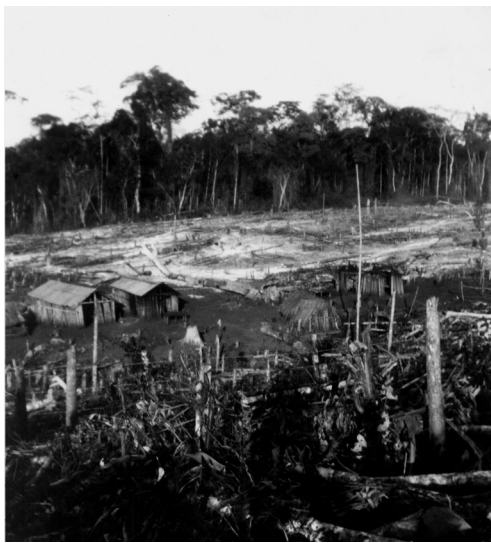
A primeira imagem de Londrina

local que mais tarde seria a cidade 1 , ele fotografou a clareira aberta no meio da mata, a fonte de água da qual se serviam e os dois primeiros ranchos de palmito, que ele e os demais integrantes da caravana dos desbravadores construíram para se abrigar das intempéries e dos animais. São os mais antigos documentos iconográficos de Londrina.