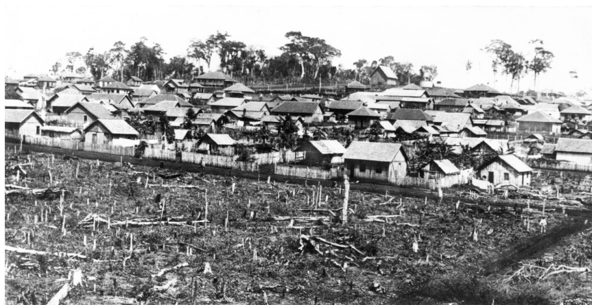
Londrina, 1934 Foto: José Juliani

ou sem vínculo com quem quer que fosse, ora ganhando mais, ora ganhando menos, em casa ou na praça, acompanhou e documentou as paisagens rurais e as transformações urbanas. Graças ao vasto documentário fotográfico que produziu sobre os primórdios da cidade, a história de Londrina, ao longo dos tempos, e mesmo hoje, pôde e pode – a partir dessas mídias visuais – ser contada, revista e acrescida.