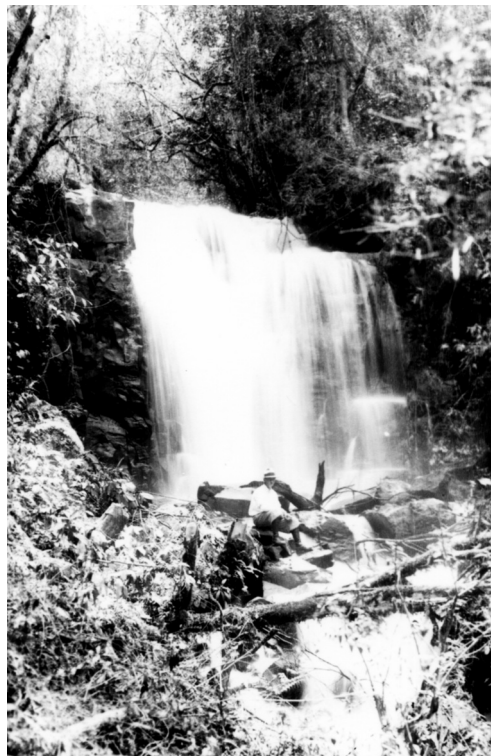
Ribeirão Cambézinho

córrego, em frente ao salto. A fotografia agradou tanto pela qualidade técnica quanto pela beleza estética. Foi enviada a Londres e acabou se tornando peça fundamental para convencer os ingleses a construírem a turbina geradora. O nome do fotógrafo era José Juliani.