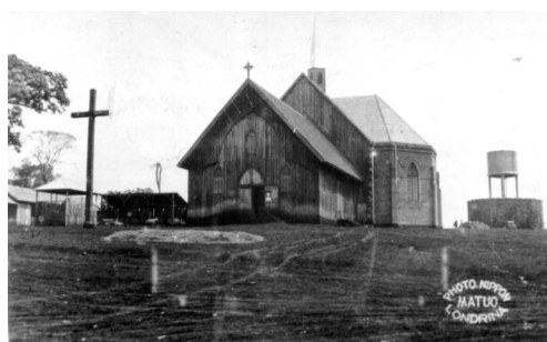
Primeira Igreja Católica de Londrina final da década de 30

A família trabalhava mais com fotografia de ateliê (retratos e fotos para documentos), mas também fazia fotos externas. Um dos nichos comerciais era fotografar a colônia japonesa. Um ponto de referência – e preferência – dos nipônicos era a escolinha da colônia. Era comum fotografar famílias ou grupos de japoneses em frente à escola. Pais posavam sisudos, mas com indisfarçável satisfação, ao lado dos filhos, diante da escola. Educação sempre foi motivo de orgulho para os japoneses. Independente do orgulho, os japoneses também eram práticos: uma foto com toda a família ficava mais barato que uma de cada um de seus membros. Era o princípio – até hoje utilizado – de unir o útil ao agradável.