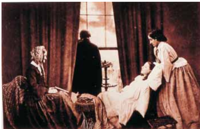
Figura 2 - Desvaneciéndose, 1858

tal vez su amante. Incertidumbre que esconde un dilema moral potenciado por el hecho de que, en una foto de temática similar, Robinson había reproducido un fragmento de una obra de Shaekespeare ( Noche de reyes , 1599): “She never told her love, But let concealment, like a worm i´the bud, feed on her damask cheek”. Aparece así una alusión al pecado, al deseo reprimido y al amor no correspondido que se combina con cierto erotismo mórbido. Aunque lo que realmente escandalizó al público de la época, tal y como apuntó Newhall (2002, p.76-77), fue la voluntad de Robinson de generar una ficción a propósito de un tema tan espinoso como la muerte de una adolescente, sirviéndose de un medio al que se le atribuía el peso incontestable de la verdad.