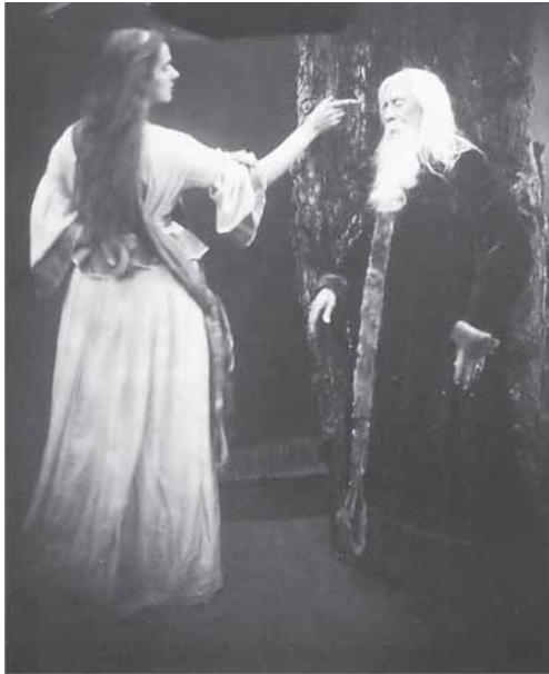
Figura 3 - Vivianne y Merlín, 1874 Fotografía: Julia Margaret Cameron Fonte: Idilios del rey, de Alfred Tennyson, 1874

escenificación y el montaje de negativos para construir composiciones inspiradas en pinturas de los grandes artistas del renacimiento, de sus amigos pre-rafaelitas así como en obras literarias de autores coetáneos. Sin ir más lejos, en 1874, el escritor Alfred Tennyson, amigo y vecino de Cameron en la isla de Wight, le encarga una serie de ilustraciones para su poemario Idilios del rey . La aurora trabajará durante más de tres meses en el proyecto haciendo que familiares, amigos y conocidos posaran para este conjunto de puestas en escena, que entrañaban una gran dificultad técnica dados los prolongados tiempos de exposición requeridos – entre siete y diez segundos.