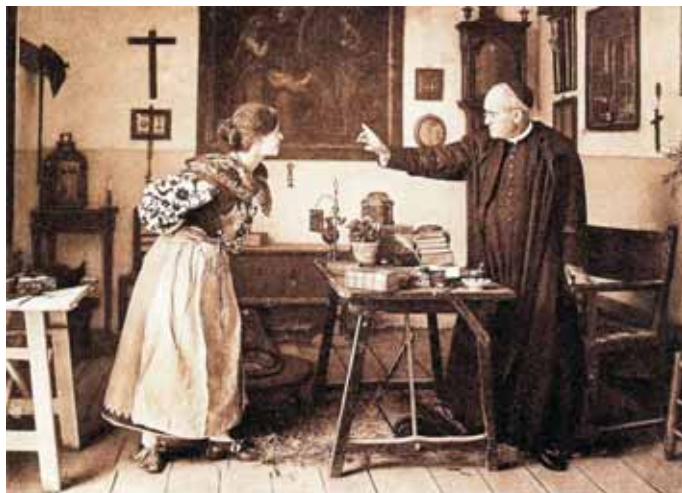
Figura 4 - ¡Quieñ supiera escribir!, 1905