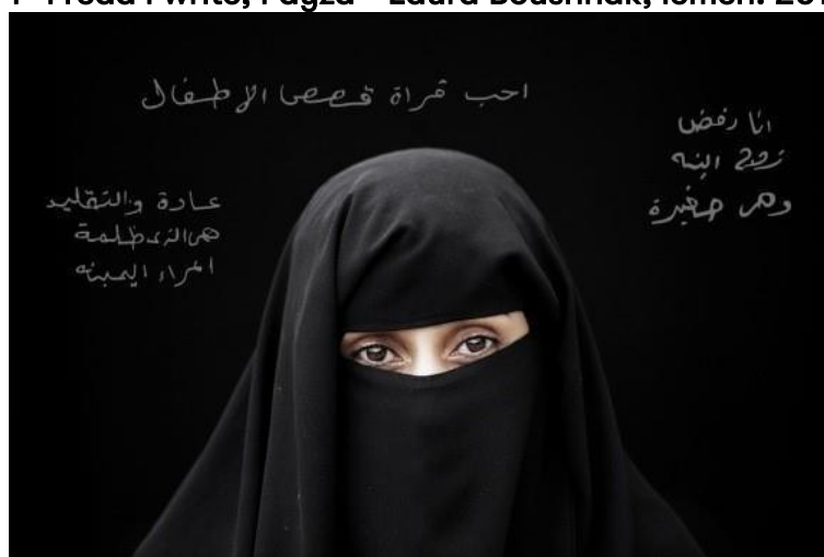
Figura 4- I read I write, Fayza - Laura Boushnak, lêmên. 2012