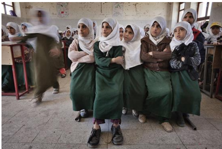
Figura 9 – I read I write - Laura Boushnak, Iemen, 2012