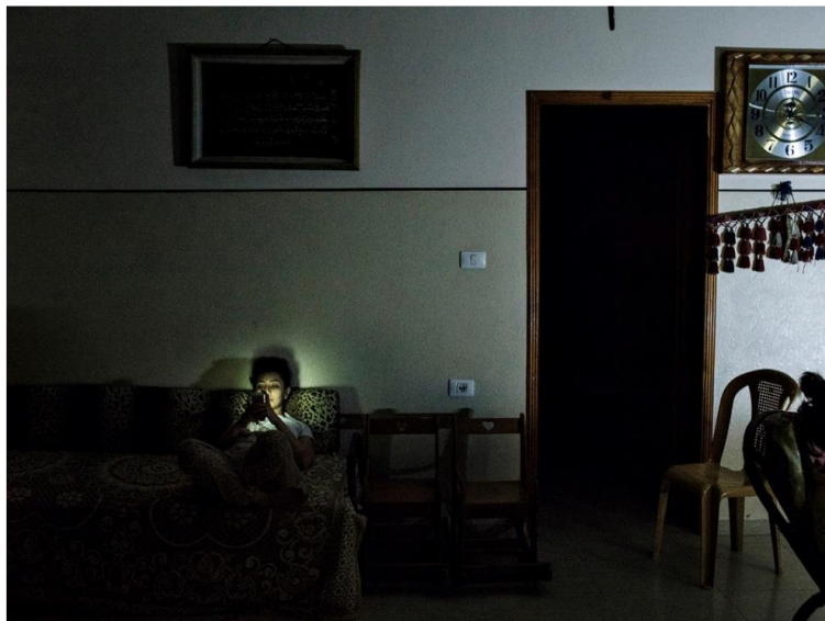
Figura 8- I read I write, Reem - Laura Boushnak, Gaza, 2016