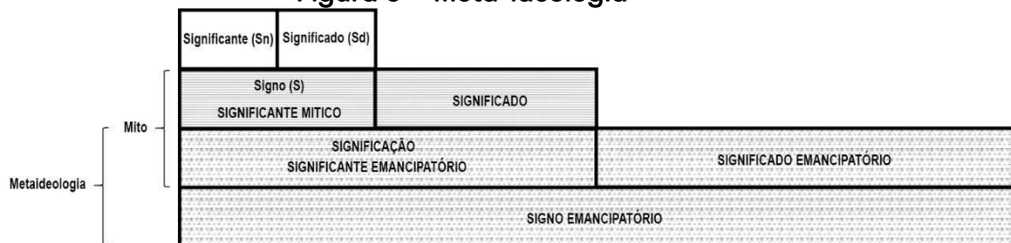
Figura 6 – Meta-ideologia

No trabalho de Boushnak, essa dinâmica se manifesta na ressignificação do hijab , que deixa de ser um emblema imposto e se torna um símbolo de luta e reivindicação. As mulheres retratadas não apenas ocupam o espaço das imagens, mas também intervêm em sua própria representação, subvertendo a lógica da opressão ao afirmar sua historicidade. A fotografia, nesse sentido, opera como um dispositivo de meta-ideologização, permitindo que o mito seja reapropriado, contestado e, sobretudo, reconstruído a partir das vozes daqueles que, historicamente, foram reduzidos a objetos de discurso.