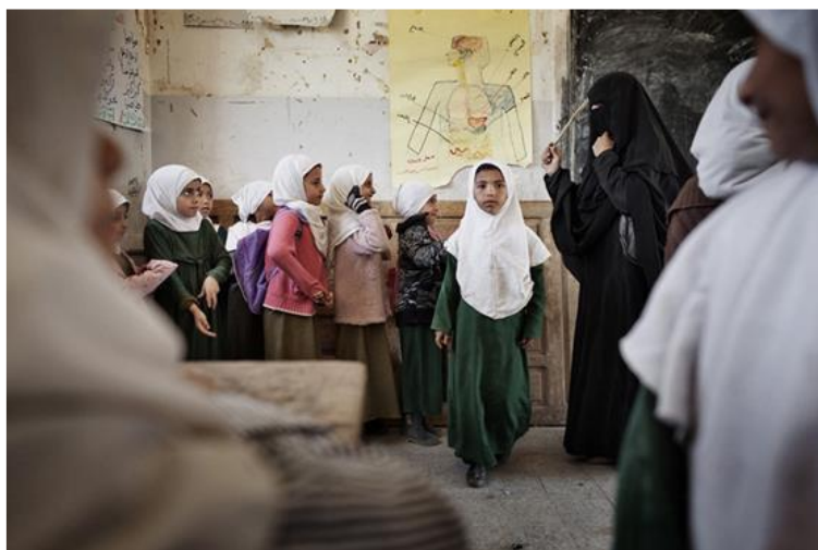
Figura 10 - I read I write - Laura Boushnak, Iemen, 2012