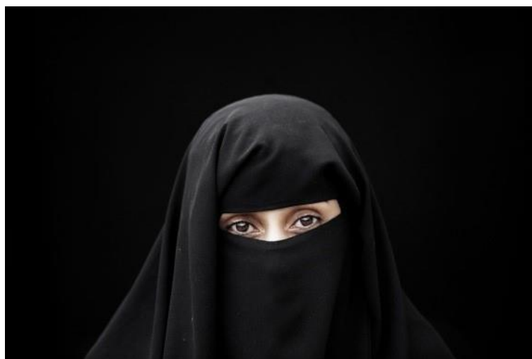
Figura 2 - I read I write, Fayza – Laura Boushnak, Iémen, 2012