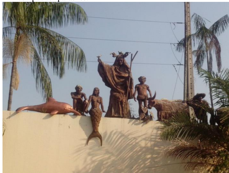
Figura 1 - A imponente Matinta Perera em monumento na Praça Waldemar Henrique, em Belém, ladeada por outros entes míticos amazônicos que inspiraram o famoso compositor paraense.

Uma vez admitidas as variações do mito da Matinta Perera, no tempo e no espaço, ao menos um traço revela-se imutável. Como Cascudo (2009) descreve e Fares (2007, p. 7, grifo nosso) amiúda, o mito tem elementos que se mostram invariantes como “a aparição da personagem mítica desassossegando os humanos com o assobio; o oferecimento de uma prenda e o restabelecimento da ordem; [e] a cobrança da dádiva prometida”. Fares (2007) também coloca a entrega da prenda como uma característica mítica invariável, tal como Silva Júnior (2014) constata entre populares da comunidade de Taperuçu do Campo, Bragança, Pará, que relataram avistamentos de matinta ao autor.