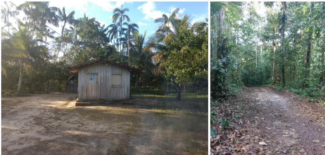
Figura 5 – À direita, um dos muitos caminhos de Curuçambaba por onde os moradores – e talvez a Matinta Perera – circulam.

Figura 4 – À esquerda, uma habitação da comunidade de Curuçambaba, com vegetação ao fundo. Casas como essa são bastante representativas da arquitetura vernacular na Amazônia brasileira.