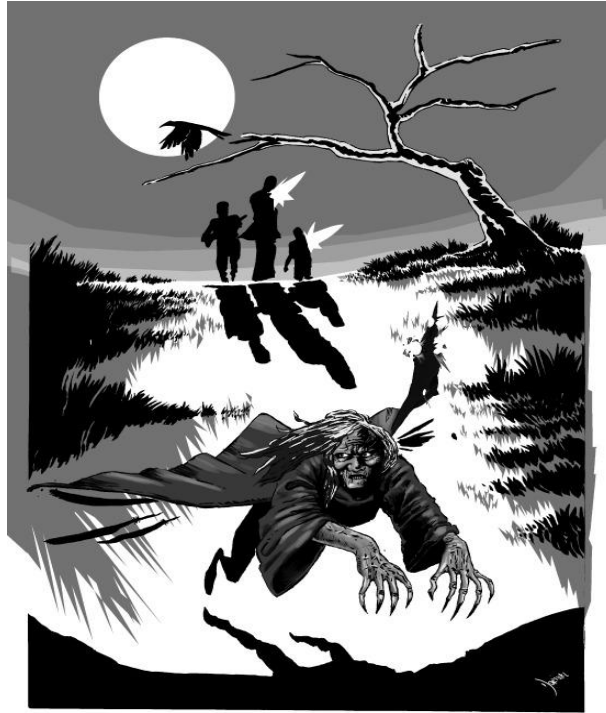
Crédito: Lourival Moraes, 2015.

Como um dos aspectos invariantes no mito, há de se notar que as prendas estão envolvidas em ações que Silva Júnior (2014) associa ao conceito de dádiva , proposto por Marcel Mauss 4 . Com efeito, para esse autor, a obrigação de dar e receber é uma relação que os populares e a Matinta Perera constroem de modo peculiar, precipuamente quando ela faz-se anunciar pelo assobio: “ fuiite, fuiite, fuiite, Matiinta Perera ” (SILVA JÚNIOR, 2014, p. 491, grifo do autor). Quem escuta esse assobio sente-se obrigado a oferecer algo em troca de sossego. E como se costuma ensinar aos paraenses, sobretudo aos que vivem nas áreas rurais e nas periferias urbanas, deve-se dizer: – Matinta, vem buscar (informa-se aqui a coisa a oferecer) amanhã. No dia seguinte, a identidade da Matinta Perera é revelada pela mulher que bate à porta para buscar aquilo que lhe foi prometido. É desse modo que os interesses revelam-se nessa relação de obrigações: (i) o propósito da Matinta, em ganhar algo de quem assombra e o dever de buscar o que lhe foi oferecido; e (ii) os propósitos da pessoa assombrada que consistem em obter sossego e descobrir a identidade da matinta.