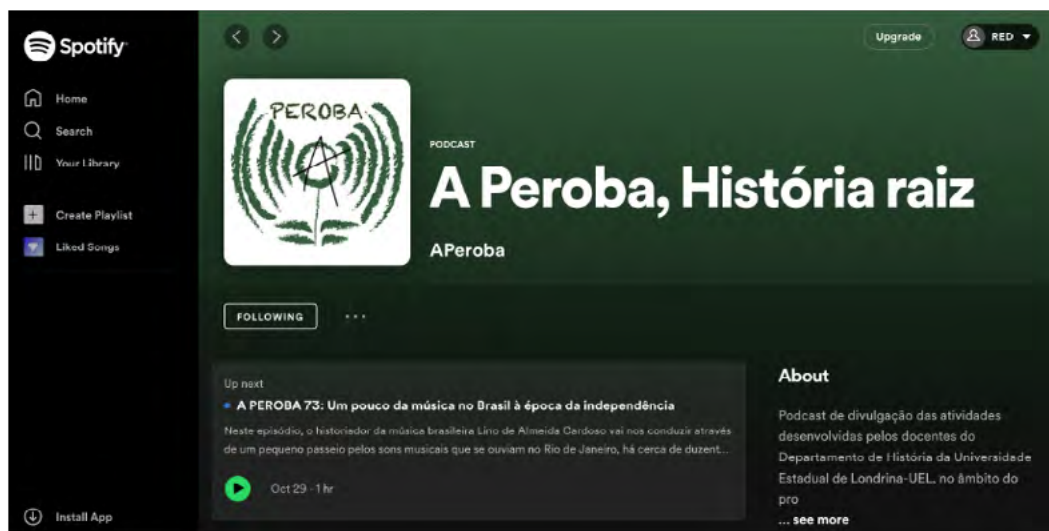
Imagem 2 - página d’A Peroba no Spotify