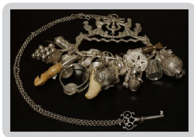
Figura 11: Pencas de balangandãs em prata com 27 peças e corrente.

Geralmente, essas joias eram usadas na cintura, por ser a zona que marca a fertilidade e, conseqüentemente, por possuir um grande significado ritual religioso. Sua disposição dava-se por meio de argolas individuais ou tiras de couro ou ainda outros materiais, em que cada peça continha cerca de 20 a 50 objetos. Eram altamente movimentados e sonoros ao se chocarem uns com os outros, tanto que lhe conferiu uma denominação de referência onomatopaica para muitos estudiosos do tema. Logo, esse potencial sonoro é inerente à sua composição, haja vista que diversos amuletos possuem a função de “espantar” as influências malignas através do som.