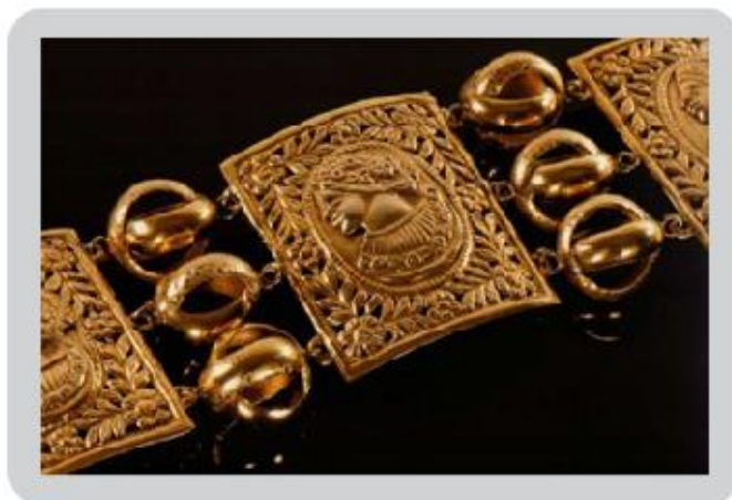
Figura 5: Detalhe de pulseira de placa, em que as placas centrais, confeccionadas com ouro estampado, são unidas por alianças entrelaçadas.

Na Bahia predominavam as pulseiras de ouro compostas de seções retangulares tendo ao centro efígies masculinas e femininas, retratos dos imperadores e imperatrizes. Por ocasião da menoridade de D. Pedro, eram comuns as pulseiras com efígies do imperador menino (OLIVEIRA apud FACTUM 2009, p.163).