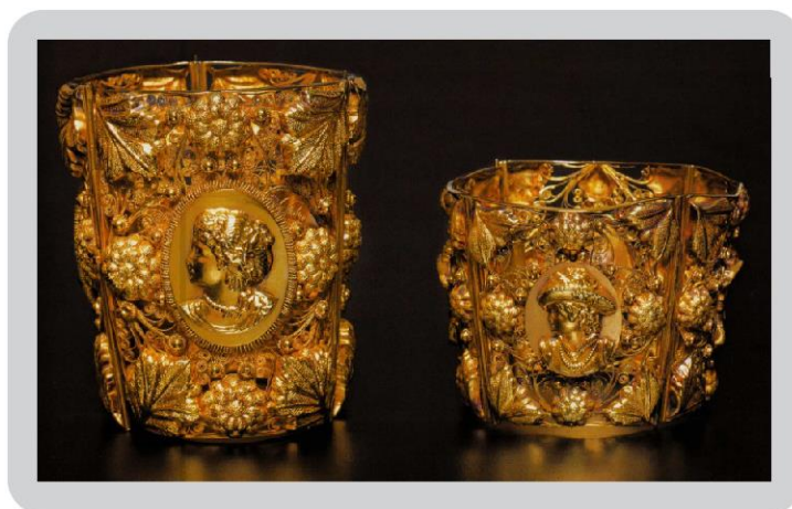
Figura 4: Braceletes em ouro.

Os braceletes copos (Fig.4) são denominados assim devido à sua forma e tamanho. Também são chamados de braceletes punho, são compostos por duas ou quatro placas, unidas entre si por articulações. Cada placa é formada por uma chapa central de metal, geralmente em ouro, estampada ou com filigranas. Os braceletes eram decorados com efígies masculinas e femininas, de feições africanas ou europeias, frequentemente eram retratos dos imperadores e imperatrizes.