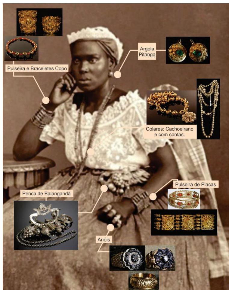
Figura 1: Fotocomposição de uma usuária e suas respectivas joias.

Durante o Período Colonial Brasileiro, por exemplo, as mulheres que aqui chegaram pelo tráfico negreiro, mesmo diante de privações de toda ordem, conseguiram materializar e fazer circular símbolos que expressavam resistência ao regime a que eram submetidas ao trazerem consigo suas culturas e seus saberes, que foram gradualmente mesclados e absorvidos, possibilitando a criação de peças icônicas de joalheria, as chamadas Joias de Crioulas 3 Afro-Brasileiras (Fig. 1).