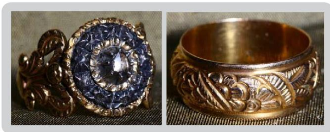
Figura 10: Anéis usados pelas crioulas

Muitos dos anéis usados pelas crioulas apresentavam características da talha barroca, (Fig.10) “tanto as jóias escravas baianas como as jóias populares portuguesas perseguiram o mimetismo com a decoração das igrejas de forma tão intensa que nos leva a conjecturar ser uma busca a sua consagração, talvez uma razão a mais para este perfil da arte barroca” (FACTUM, 2009, p.174). Outros exemplares apresentam uma concepção híbrida, em que a base do anel segue o estilo da talha dourada barroca e seu topo central é em metal oxidado e pedra branca, geralmente um diamante ou uma safira branca, característico da joia vitoriana.