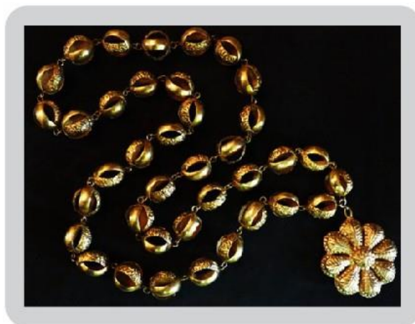
Figura 8: Correntão de alianças lisas e decoradas com pendente de roseta, ambos em ouro.

O colar de alianças, grilhões ou correntões cachoeiranos, geralmente eram formados pelo encadeamento de elos em formato de alianças que podem ser lisas ou decoradas, que se entrelaçam. Alguns exemplares também trazem pendentes com símbolos católicos (Fig. 8).