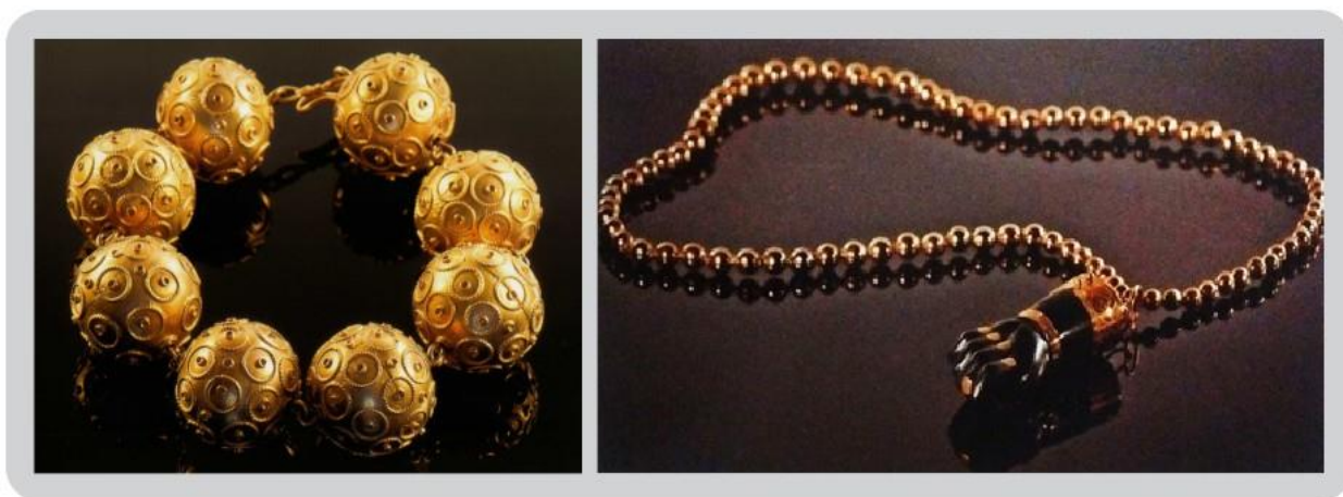
Figura 6: Pulseira feita com contas confeitadas e correntão de contas lisas com figa de ébano e ouro Fonte: CUNHA; MILZ, 2011, p.89 e p. 91.

As contas 14 foram peças importantes da ourivesaria baiana, sendo utilizadas em pulseiras e colares (Fig.6). Geralmente redondas essas joias podiam ser lisas ou confeitadas com filigranas e pequenos grãos de ouro, com formas e tamanhos variados. A sequência de contas formam pulseiras e colares que possuíam tamanhos variados e eram utilizados como adornos ou de uso devocional.