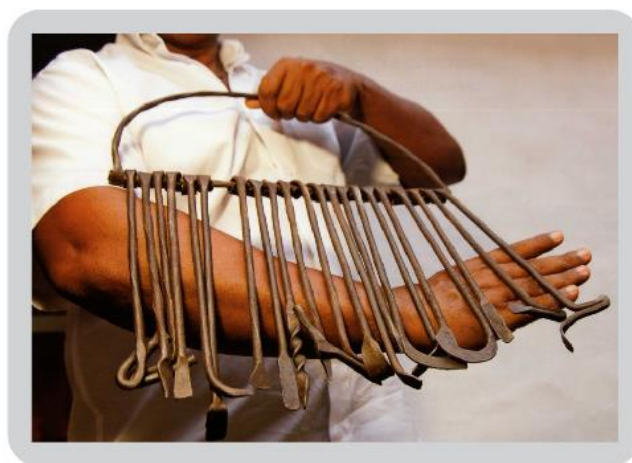
Figura 12: Ferramenta de Ogum.

Este orixá é um deus da guerra e o seu fetiche é um fragmento de ferro, na África e entre os negros da América Latina. Ainda mais: como uma divindade das lutas, carrega consigo os seus apetrechos bélicos de ferro (espada, foice, lança, pá, enxada, etc.), chamados na Bahia a ferramenta de Ogum (RAMOS, 1940, p.41).