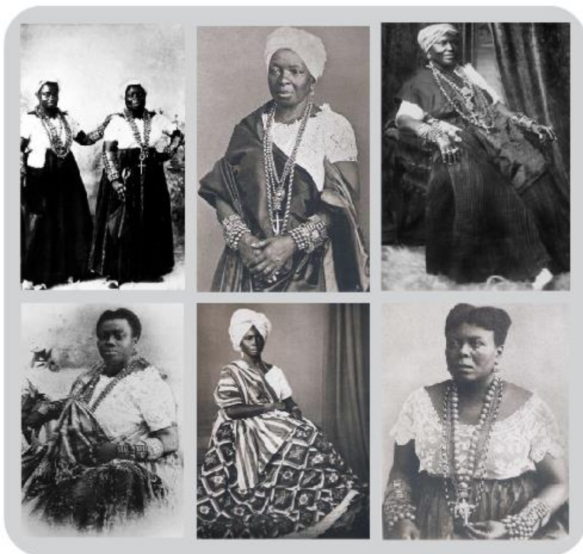
Figura 3: Mulheres negras portando exemplares da joalheria afro-brasileira.

As joias de crioulas, enquanto objetos da cultura material possuíam uma estética peculiar quanto à dimensão, ao peso, ao formato e à decoração, pois são joias de grandes proporções, embora geralmente sejam ocas, além de serem profusamente decoradas e usadas em quantidade pelas suas portadoras (Fig.3). Tais joias se opunham das utilizadas pelas senhoras brancas, que geralmente preferiam peças importadas da Europa ricamente decoradas com diamantes, pérolas e outras gemas (CUNHA; MILZ, 2011, p.46).