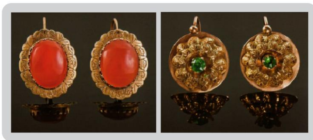
Figura 9: Brinco com cornalina em lapidação cabochão oval e brinco com vidro verde lapidado em facetas

[...] alguns seguindo modelos tradicionais afro-baianos, como barrilzinho - conta cilíndrica em torno de 2cm de comprimento e 1cm de diâmetro, com variantes, sendo geralmente uma firma rajada bicolor, uma firma africana, um coral verdadeiro, ente outras (Lody, 2001, p.113).