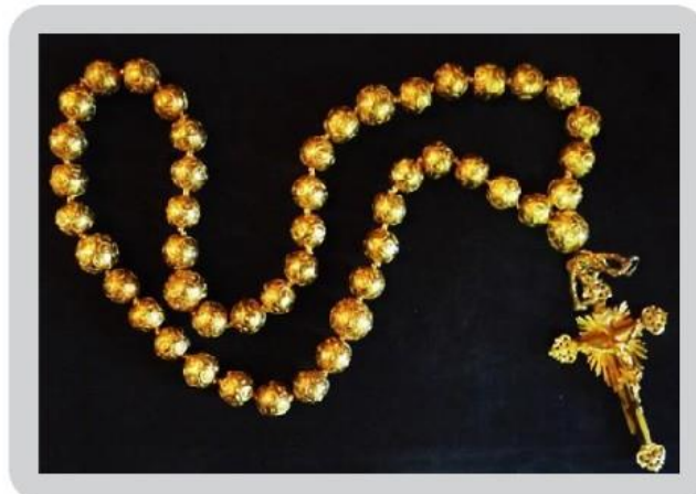
Figura 7: Correntão feito com contas confeitadas e pendente em forma de cruz de raios.

Os correntões de contas confeitadas foram muito populares entre as crioulas. Chegavam a medir mais de um metro e meio de comprimento. Em alguns exemplares, era comum pender da corrente uma peça de ouro, que podia ser uma figa, um coração, uma rosácea ou um crucifixo (Fig.7). Em outros correntões menores, as contas de ouro são associadas a cilindros de coral.