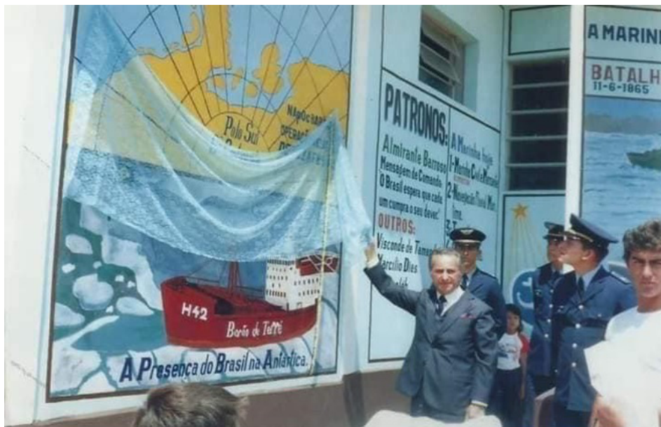
Figura 6 - Detalhes das paredes externas do Santuário Deus e Pátria