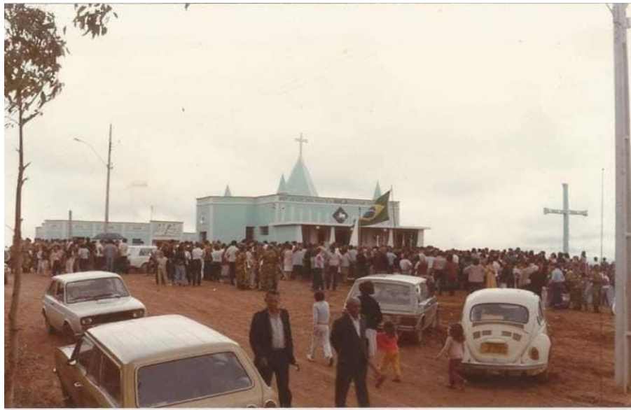
Figura 5 – Inauguração do Santuário Deus e Pátria