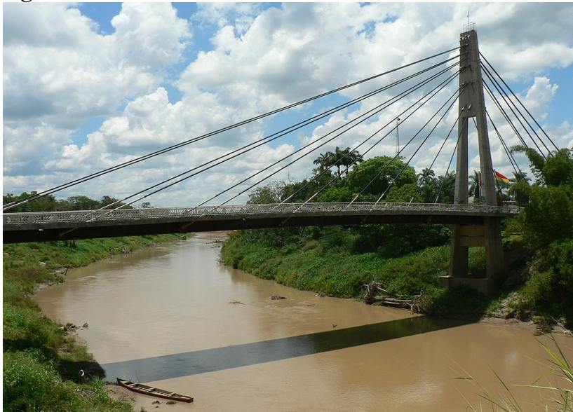
Figura 1 - Ponte Binacional Wilson Pinheiro ou Ponte da Amizade