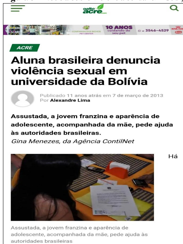
Figura 3 - Notícia sobre violência sexual em Cobija

ano de 2012, sob o título, “Médico boliviano é denunciado por estupro de brasileiras em universidade de Cobija” 20 , percebemos o panorama dessas tessituras de poder que desaguam em abusos, enfim, em geografias e/ou paisagens do medo através da violência psicológica, sexual, conseqüentemente, psíquica, como destacado anteriormente (veja figura 3).