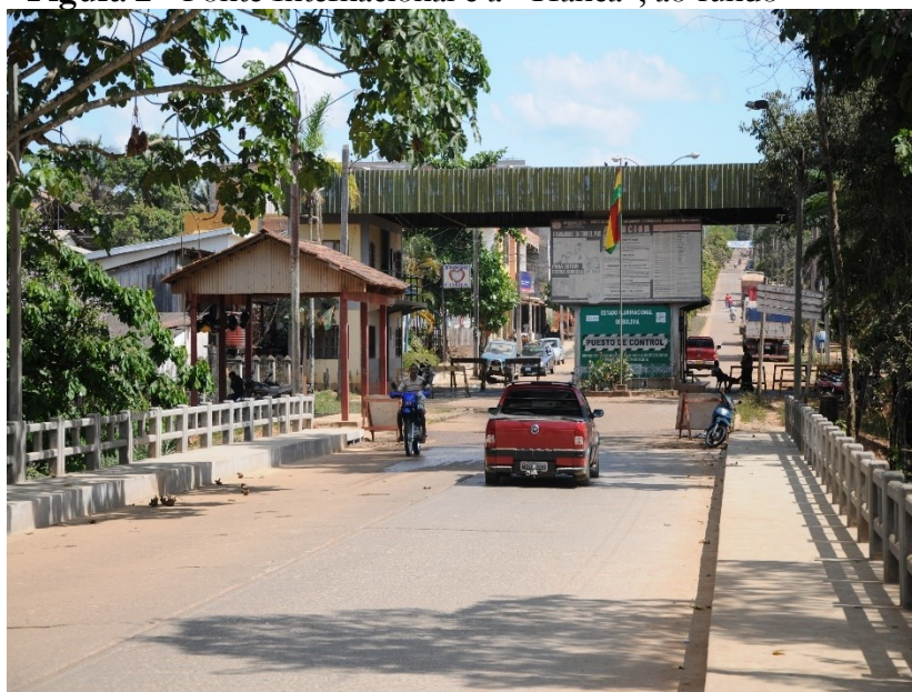
Figura 2 - Ponte Internacional e a “Tranca”, ao fundo

Na figura 2, coadunando ao mapa 1, temos a ponte Internacional, no município de Epitaciolândia, e, ao fundo, a denominada “tranca” — posto de fiscalização boliviano da cidade de Cobija —, sendo essas duas, as ligações terrestres entre os Estados.