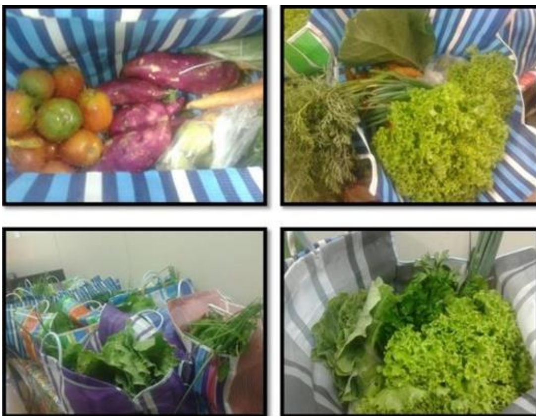
Figura 3 – Sacolas Camponesas

Trata-se de um projeto portanto, que visa fomentar a agricultura agroecológica, destacando a importância do consumo de alimentos sem agrotóxicos pela população e a um preço acessível para os apoiadores e colaboradores do projeto. Destaca - se que qualquer cidadão pode se cadastrar e adquirir os referidos produtos.