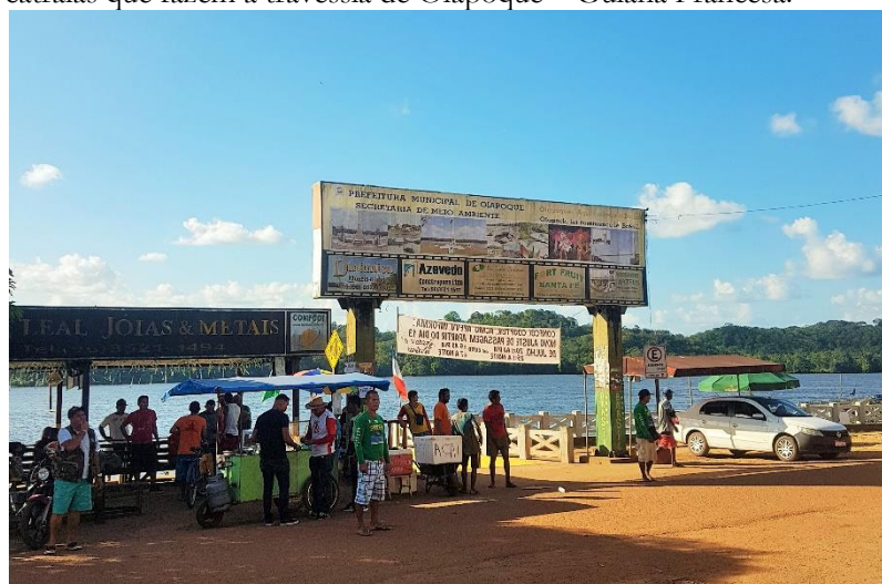
Figura 2: Parte da orla de Oiapoque, conhecida como Beira, um dos pontos de entrada e saída das catraias que fazem a travessia de Oiapoque – Guiana Francesa.

[...] Oiapoque baliza a fronteira norte do Brasil com a Guiana Francesa - um departamento ultramarino francês encravado no continente sul-americano. Cidade de Oiapoque forma com Saint George - pequeno vilarejo francês de forte presença militar – uma zona de fronteira bastante antiga e estagnada. Oiapoque é uma cidade-marco e como tal, possui a sua frase símbolo: “aqui começa o Brasil”. Além dessa frase, o chavão “do Oiapoque ao Chau?”, reforça a idéia de fronteira e dos contornos da nação, colocando o nome dessa pequena cidade amazônica no cenário nacional. (NASCIMENTO; TOSTES, 2008, p. 2).