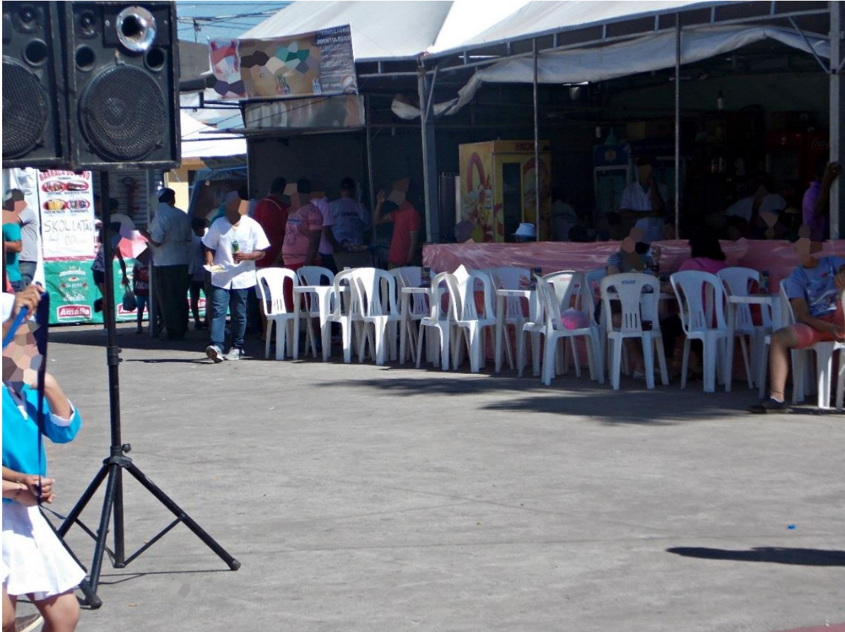
Figura 2 – Barracas com cadeiras do lado do fora

apresentações culturais: motivo de reclamações dos Congadeiros, e de capitães de ternos do município.